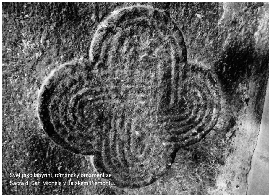
Svět jako labyrint, románský ornament ze Sacra di San Michele v italském Piemontu.