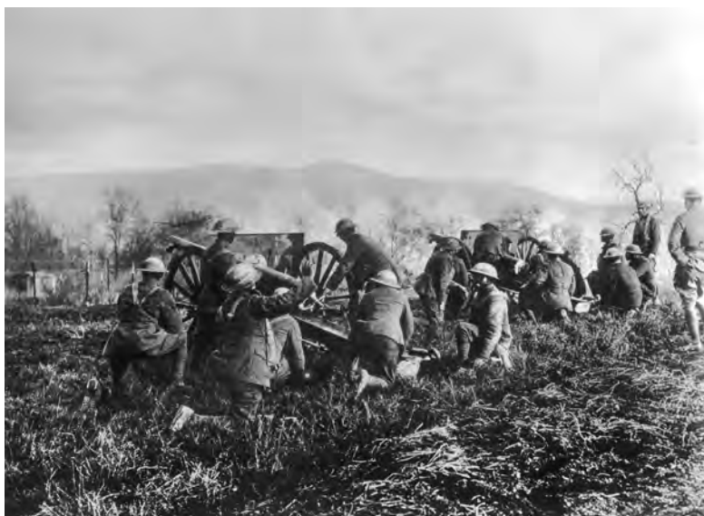
Za první světové války si muselo uniformy obléknout na všech stranách front na 70 milionů mužů.

i formou, která potvrzuje existenci svrchovaného státu," řekl Orlando později ve sněmovně. „Závazky zahrnuté ve smlouvě jsou oboustranné. Toto první uznání je dílem pana Štefánika.“