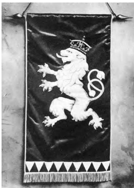
Už v srpnu 1914 vznikla ve Francii rota Nazdar (zástava na fotografii) o 300 mužích, která na jaře následujícího roku zasáhla do bojů s Německem.

na Soče... Generální štáb německý dělal plány o vybudování obranné čáry rýnské a Ludendorff měl přemluvit císaře Karla, aby po ústupu na Soču poskytl několik divizí na Rýn ke krytí ústupu německých vojsk. Pokus ten ve Vídni úplně ztroskotal.“