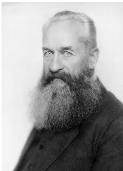
Princ Georgij Lvov, předseda Prozatímní vlády od 15. března do 5. července 1917

bolševické strany Leninem. Co by se stalo, kdyby se Rus s Američanem sešel? Těžko domýšlet, nakolik by to mohlo změnit dějiny.