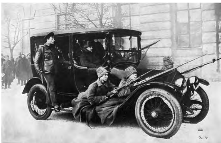
Poslanci Dumy s ozbrojenou ochranou

Berlín rozehrál podvratnou hru i v dalších zemích. Bývalý britský diplomat Roger Casemat usiloval za pomoci Německa o odtržení Irsku od Velké Británie, ale byl zatčen a v létě 1916 skončil jako zrádce na popravišti. Ve Francii zase