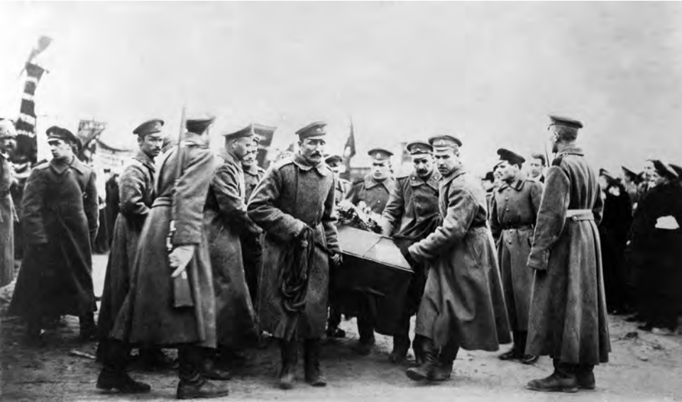
Únorová revoluce. Pohřeb více než 150 osob zabitých carskými ozbrojenými silami 11. března 1917 v Petrohradě během protiválečných demonstrací

na němž Lenin vytiskl první číslo svého časopisu Iskra ( Jiskra ), a to pak sociálnědemokratický nakladatel H. Dietz pašoval do Ruska.