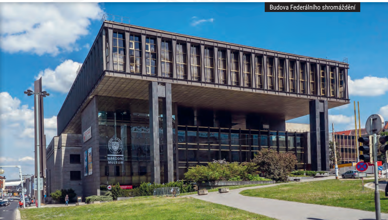
Budova Federálního shromáždění

✉ Vinohradská 51/1, Praha 1 📍 GPS: N 50°4.78752', E 14°25.90773'