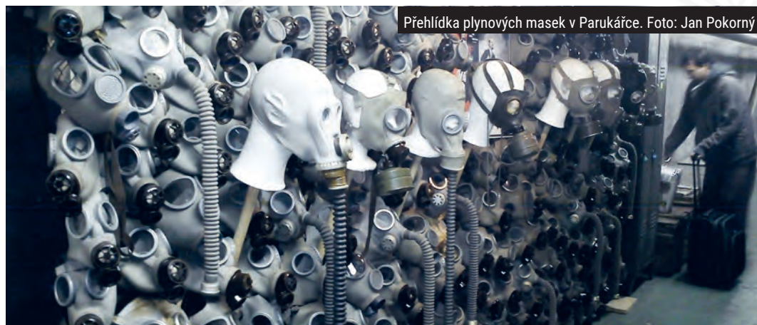
Přehledka plynových masek v Parukářce.

🕒 individuální 💎 do 100 Kč ✉ v areálu parku Parukářka, Praha 3 📍 GPS: N 50°5.05500', E 14°27.48400' 🖱 bunkr-bezovka.cz