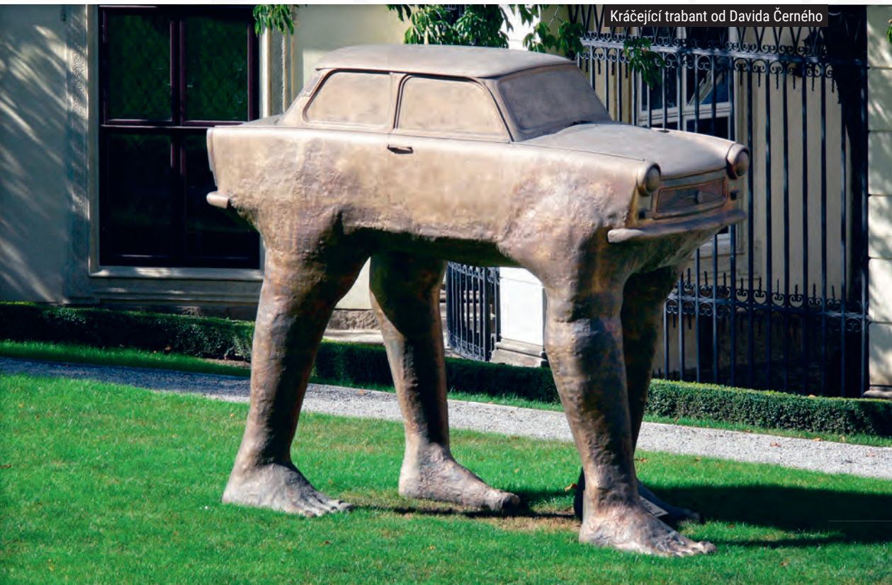
Kráčející trabant od Davida Černého

✉ Německé velvyslanectví, Vlašská 347/19, Praha 1 📍 GPS: N 50°5.21072', E 14°23.87148'