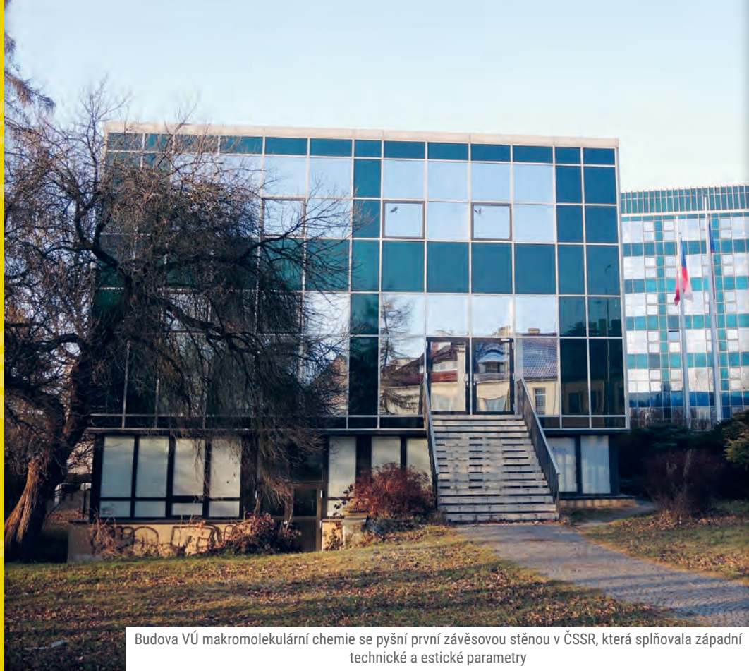
Budova VÚ makromolekulární chemie se pyšní první závěsovou stěnou v ČSSR, která splňovala západní technické a estické parametry