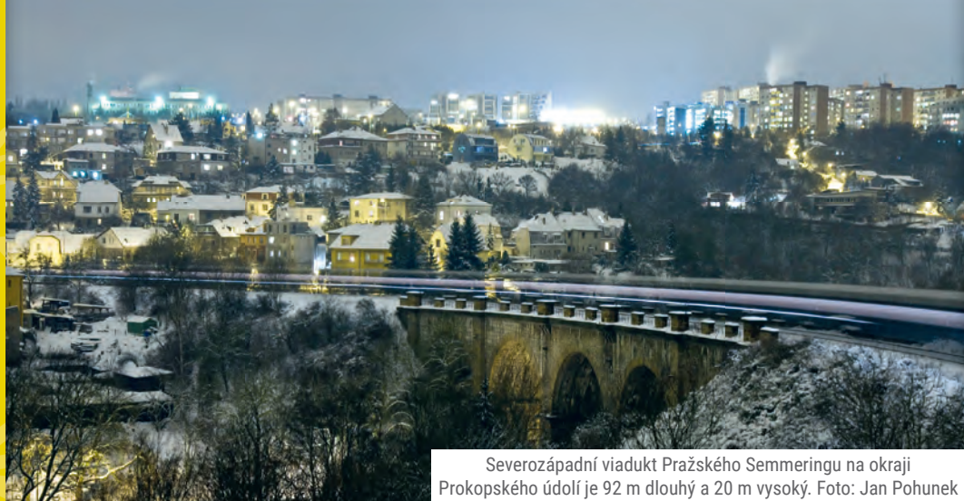
Severozápadní viadukt Pražského Semmeringu na okraji Prokopského údolí je 92 m dlouhý a 20 m vysoký.