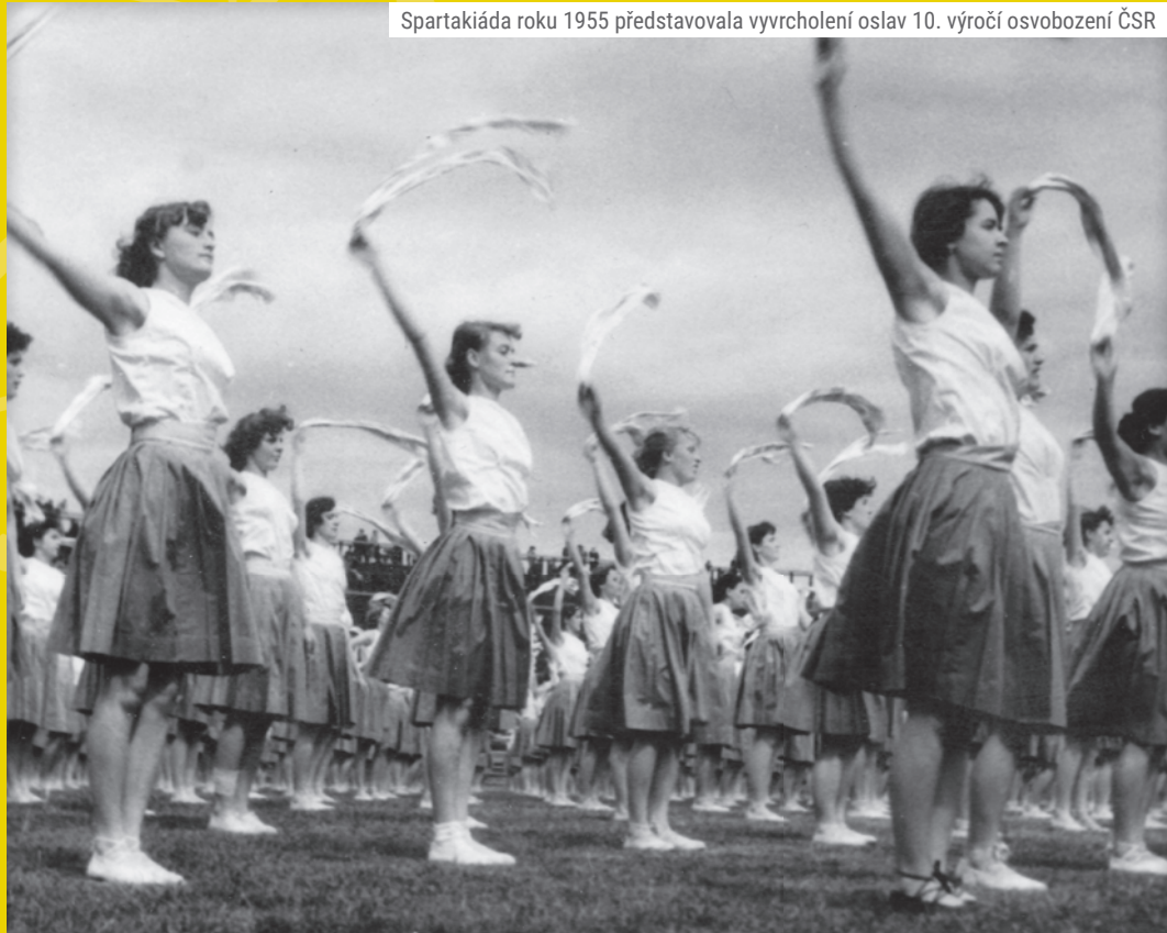
Spartakiáda roku 1955 představovala vyvrcholení oslav 10. výročí osvobození ČR

Poslední spartakiáda se konala roku 1985 a poté až roku 1994 proběhl dávno plánovaný XII. všesokolský slet. Byla to také bohužel poslední velká sportovní akce v tomto areálu.