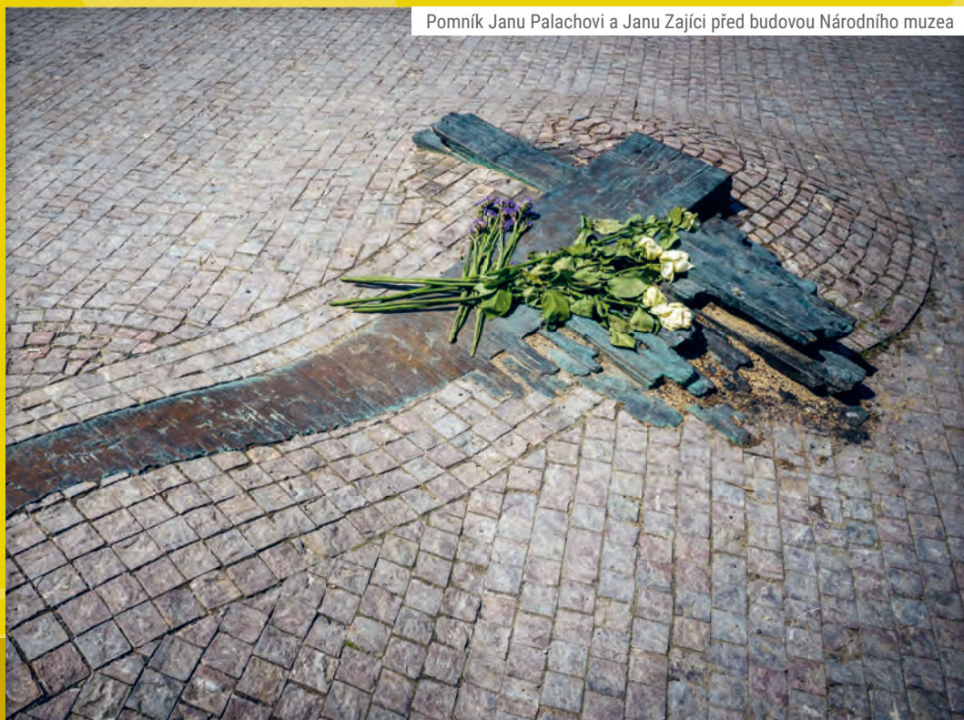
Pomník Janu Palachovi a Janu Zající před budovou Národního muzea

Evžen Plocek (29. 10. 1929–4. 4. 1969), jihlavský dělník, člen KSČ a stoupenec reformní politiky, se na náměstí v Jihlavě stal pochodní č. 3, ale jeho čin se již podařilo lépe utajit. Přestože se jeho pohřbu zúčastnilo okolo pěti tisíc lidí a proměnil se v masovou demonstraci, do celostátních médií neproniklo jediné slovo.