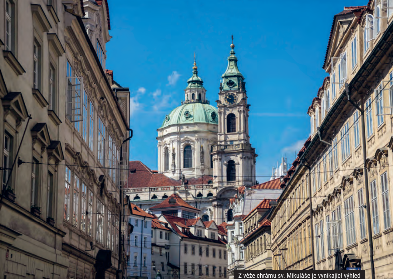
Z věže chrámu sv. Mikuláše je vynikající výhled