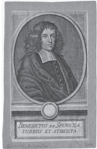
Baruch Spinoza. Dobový popisek jej dvojnásobně dehonestuje: Žid a ateista

S nadšením psal o Spinozovi Johann Wolfgang Goethe: „Tento duch, který na mne tak rozhodně působil a který měl mít na celý způsob mého myšlení tak velký vliv, byl Spinoza... Vše vyrovnávající klid Spinozův kontrastoval s mou vše rozjitřující snahou, jeho matematická metoda byla opakem mého poetického smýšlení a zobrazování a právě onen uměřený způsob jednání, který byl považován za nepřirozený pro mravní předměty, ze mne udělal jeho vášnivého žáka, jeho nejodhodlanějšího ctitele.“ 2 Německý básník Heinrich Heine v jednom ze svých esejů ke Spinozovi řekl: „Když Spinozu vyprostíme ze strnulé, zastaralé karteziánské matematické formy a zpřístupníme jej širokému publiku, pak