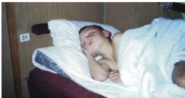
No tati, že se nestydíte, takhle mě fotit, když spím!

Pamatuju si, že cesta byla strašně dlouhá. Trvala třeba den a půl nebo přibližně tak. Cestou jsme museli zastavit v nějakém městě na Slovensku, kde náš vlak zvedli a měnili rozchod kol. Na