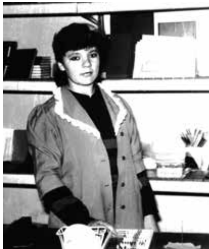
Maminka se vyučila prodavačkou.

Doma jsem hned přišel za dědou, protože táta v té době někde sháněl práci, a vyprávěl mu, co se hned první den ve škole semlelo.