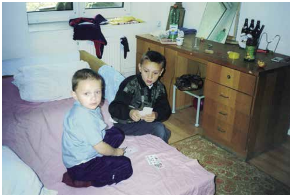
Takhle jsme se bavili, když byli rodiče v práci. Hráli jsme ukrajinskou karetní hru Durak.

Příjezd do nového domova nesporně splnil všechna naše očekávání. Všechno bylo sice hodně jiné než v mých představách, ale v tu chvíli určitě přijatelné.