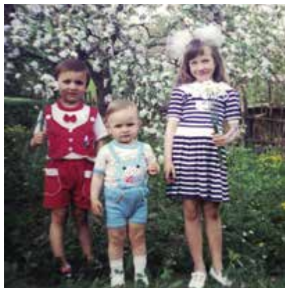
To by mě zajímalo, jestli jsme se do těch oblečků navlíkli dobrovolně!