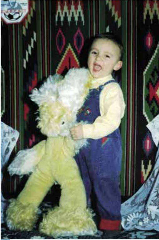
Pravá nefalšovaná dětská radost z maličkosti!

bráškovi, holomkovi jednomu, věnovali více než mně, a tak jsem pěkně žárlil. Ale těžší to bylo zejména pro moje rodiče.