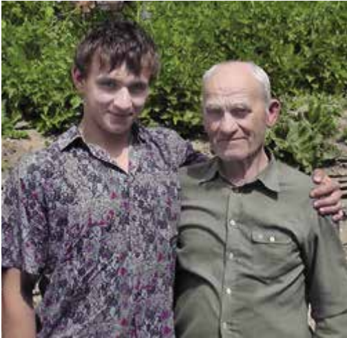
Léto 2011, návštěva příbuzných na Ukrajině. To je ten dědeček, se kterým jsem chodil rybařit. 😊

u nás tou dobou topilo, protože zemní plyn tam ještě v domácnostech zavedený nebyl.