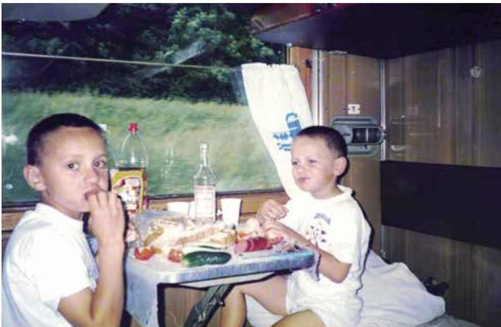
Nádherná slovenská příroda a mňamózní jídlo na cestě do Česka.

Ukrajně a v celém Rusku jsou totiž koleje širší než v jiných zemích. Hrozně nás zajímalo, jak to dělají a proč vlastně, bylo to jako zjevení. Ovšem seděli jsme ve vlaku a zvenku jsme na to koukat nemohli.