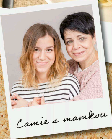
Camie s mamkou