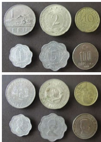
Mince (pohled z obou stran)

Pokud se jedná o instituce, které se věnují sběratelské činnosti a současně studiu sbíraných předmětů, patří mezi ně celá řada světových muzeí. Mezi známé numismatické sbírky patří např. sbírka londýnského