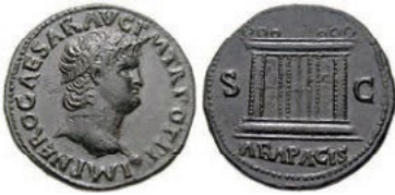
As z dob císaře Nerona [3]

Jednalo se o římské platidlo, později minci. Aes, které představují nejstarší platidla na Apeninském poloostrově, Sicílii a jihozápadním Balkáně, oplývaly různou typologií. Zhotovovány byly litím z forem, nikoliv ražbou, která je dnes jedinou mincovní technologií. Jako materiál sloužila tzv. surová měď (Aes Rude).