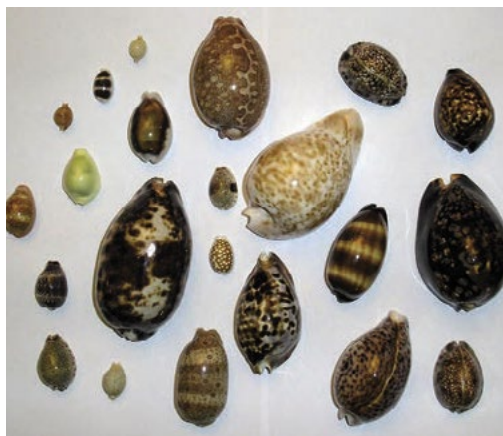
Mušle jako platidlo [1]

Jako starověké platidlo lze označit as (pl. aes; asses), v zahraniční literatuře častěji nazývaný assarius . Římané zavedli tento peníz v roce 289 př. n. l.