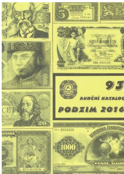
Aukční katalog a odborný časopis

Dělení sběratelských oborů není sjednocené a je na ně celá řada názorů. Pokud bychom je chtěli kompletně reprodukovat, čtenář by se v koncentraci informací ztrácel. Proto přijmeme následující dvě hlediska dělení, která se objevují nejčastěji.