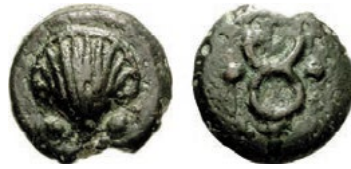
Sextans, přibližně 289–245 př. n. l. [4]

zachovaných exemplářů je 267,86 g. Byly zavedeny na italském území na rozhraní 4. a 3. století př. n. l., spadají tedy do samých počátků historie římského mincovnictví. Původní římské Aes Grave jsou na lici označeny dvojitou hlavou boha Januse a na rubu tzv. prorou (hrot, příď, přední část lodě). Příkladem Aes Grave je mince označovaná jako sextans. Ta pochází z období 3. století př. n. l.