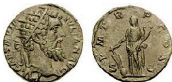
Dupondius ražený v Římě pravděpodobně v letech 147–150 n. l. [6]

obchodníků, že si u nich lidé uložili mince z kovu. Později tento systém převzala sama vláda, aby se proces obchodu zjednodušil, a vydávala certifikáty o stejných hodnotách, které sloužily jako předchůdci bankovek.