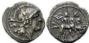
Sestertius bez bližší identifikace [5]

Mimo as existovala v období kolem roku 269 př. n. l. také starověká římská mince známá pod označením sestertius , příp. sesterce (pl. sestertii) nebo denár. Během římské republiky byl sestertius ražen jen zcela ojediněle a měl podobu malé, stříbrné mince. Naopak během římského císařství to byla velká mosazná mince.