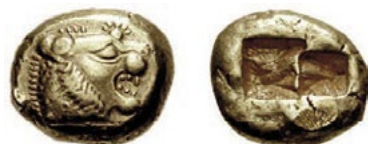
Statér – Lydie, 6. století př. n. l. [2]