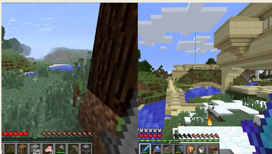
Obrázek 0.4 – Mezi těmito obrázky uběhlo pět a půl roku

Bylo to tam takové hezké – byla tam blízko voda, trhlina, bylo tam jídlo a podle mě to bylo úplně ideální prostředí pro začátek. Zakopat se je děsně jednoduché vždycky na začátku. Tak jsem tam prostě zůstal. A ten druhý screen vedle prvního je děsně vtipný.