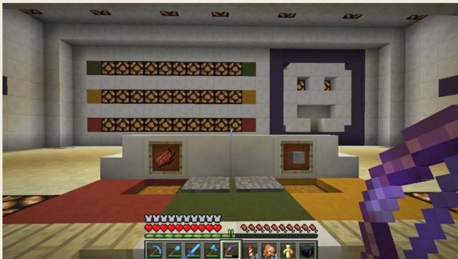
Obrázek 0.7 – Mazlík je spokojený a usmívá se

Jeden příklad za všechny je MAZLÍK. Nejedná se tedy přímo o můj nápad – možná je to přejaté odněkud, i když si nedokážu vybavit, kde jsem ten nápad viděl. Začal jsem pak tu myšlenku rozvíjet. Podle mě teda něco takového postavil Etho a já jsem od něj tu myšlenku