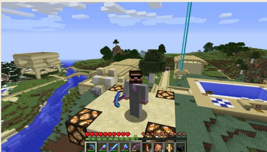
Obrázek 0.10 – Z tohoto místa se vám hlásím (skoro) každou neděli vždycky ve tři odpoledne

Navíc příručky, co jsou na trhu, se mi zdály zastaralé a myslím si, že ani jedna z nich není na nejnovější verze. A taky všechny vyšly původně v angličtině a neexistovala žádná česky psaná. No a další důvod je ten, že si opravdu reálně myslím (možná trochu namyšleně), že za těch šest let jsem nasbíral spoustu zkušeností, takže věřím, že mám hodně postřehů a rad, které můžu předat.