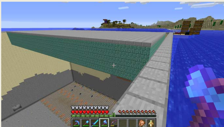
Obrázek 0.5 – Osudová guardian farma – asi nejnáročnější projekt

Kdybych se teď měl zaseknout na tom, že už mám všechno postavené, že už nic nepotřebuji, tak už jsem dávno skončil, ale je to i o tom, že se ty věci snažís dělat lepší a lepší. Zvelebovat je.