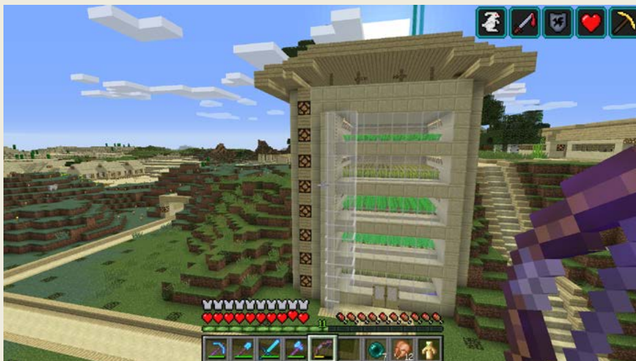
Obrázek 0.6 – Plně automatická farma na obilí

Kdybych se teď měl zaseknout na tom, že už mám všechno postavené, že už nic nepotřebuji, tak už jsem dávno skončil, ale je to i o tom, že se ty věci snažís dělat lepší a lepší. Zvelebovat je.