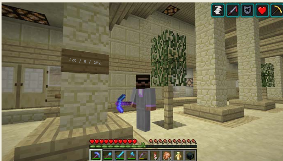
Obrázek 0.1 – Zdravím všechny čtenáře a čtenářky od své základny

Pak jsem se seznámil s Gonkim, který to dřív také natáčel. Dali jsme se do řeči a já jsem mu začal spravovat facebookovou stránku. A pak mi tam lidé začali psát, ať začnu natáčet taky. Takže vlastně na popud těchto lidí jsem se rozhodl, že taky něco zkusím natočit. Moje první video té minecraftí série jsem vydal tuším 15. ledna 2012. V současné době, kdy děláme tento rozhovor, mám natočených přes 250 dílů a ta série pořád pokračuje. Je to pro mě strašná nostalgie.