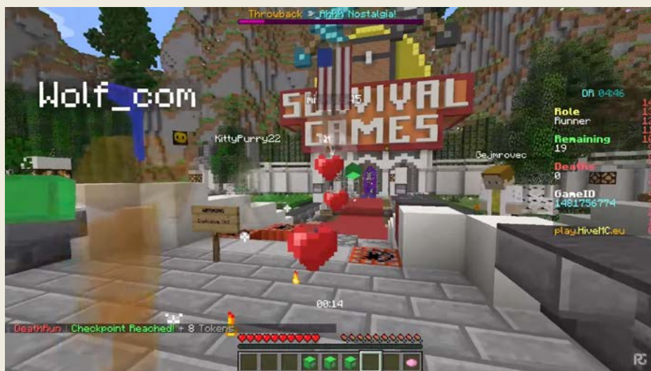
Obrázek 0.3 – Multiplayer je obrovský zdroj zábavy, hlavně různé minihry

To jsem měl takový stav, kdy mě to nebavilo, kdy jsem přemýšlel, že to ukončím. Ono je to jako na vlnách. Já nikdy nedělal zbrklá rozhodnutí. Vždycky, když mě toto potká, což už