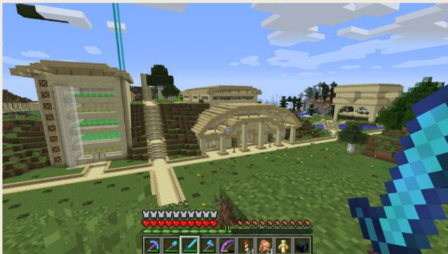
Obrázek 0.9 – Můj design se někomu nelíbí vůbec, jiní ho docela chválí

Někdo je zase dobrý s redstonem, někdo v kreativním stavění a podobně. Tedy v Minecraftu si každý může najít svůj druh toho, v čem bude vynikat. Já bych tedy neřekl: „Jsem dobrý v Minecraftu.“ Spíš bych to formuloval tak, že „v Minecraftu už jsem ovládl