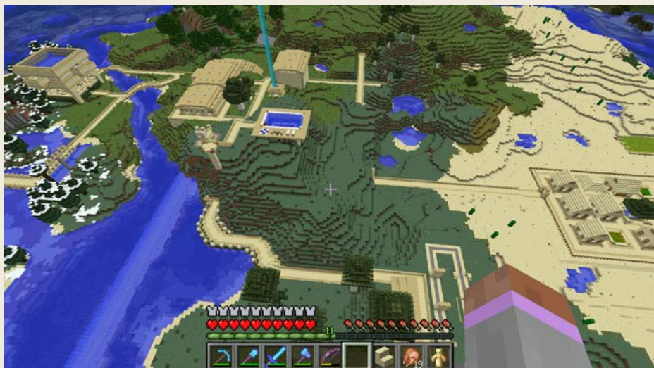
Obrázek 0.8 – Letecký pohled na část mého světa

Třeba farmu na dřevo plánuji už 150 dílů a pořád ji nemám. Pořád nejsem schopen si najít nebo vymyslet nějakou dobrou verzi. Verzi, která by se mi líbila. Která by fungovala tak, jak já chci.