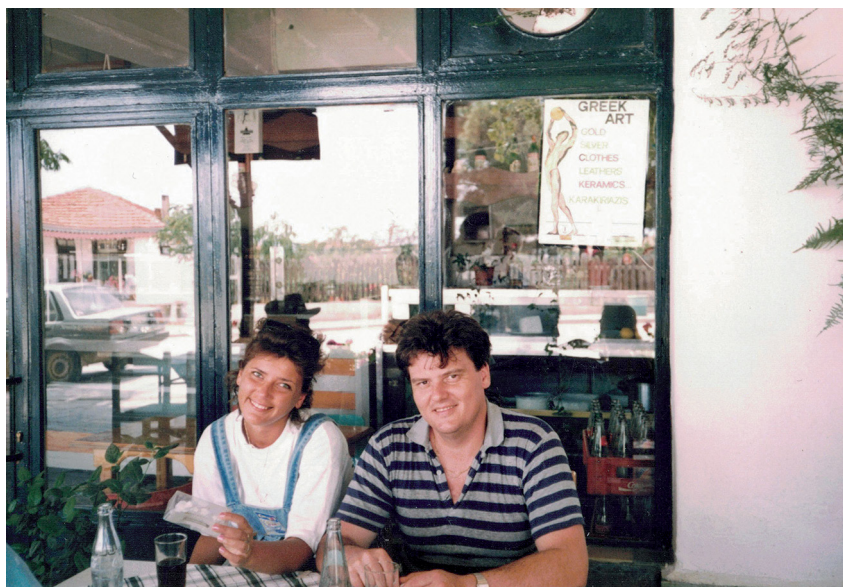
Mamka s tatkou na dovolené.

Už není tajemství, že jsme se rozhodli adoptovat. Nikdo se ale nevyptává, asi je to tabu. Snažím se zaplašit větu svého známého,