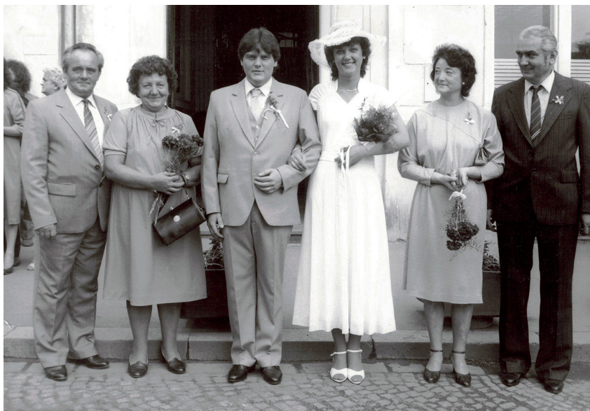
Fotka ze svatby rodičů. Zleva dědeček a babička, tatka, mamka, babička a její bratr.

Dneska je krásný den. Jupí, já se vdávám! Možná jsem se trochu zbláznila, ještě mi není ani 21 let. Možná si řeknete, kam se ta holka žene, po půl roce chození s chlapem... Ale já vím, že jsem šťastná, že to prostě chci a že Jirunka, můj nastávající, je prostě ten pravý. Když se