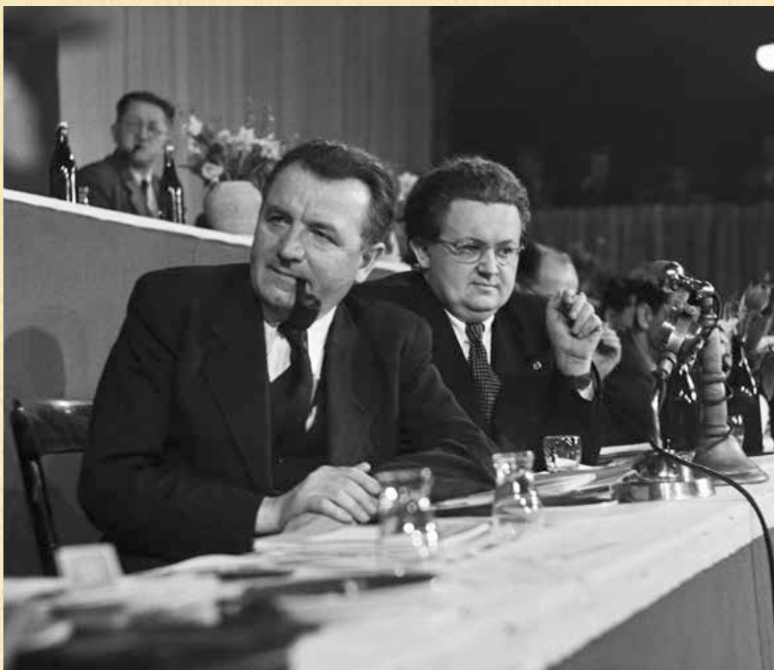
Ikona KSČ. Stranický předák, předseda vlády, protagonista „Vítězného února“ a pozdější „první dělnický prezident“ K. Gottwald s neodmyslitelnou dýmku v ústech. Po jeho levici spisovatel Jan Drda.

Komunisté strany ve východoevropských státech v letech 1945 až 1989 svým občanům tvrdily, že budují prozatím jen „socialistickou společnost“ s konečným cílem její pozdější přestavby na dokonalou beztřídní „komunistickou společnost“. Ta se měla obejít bez peněz, armády, bezpečnosti a dalších nezbytných prvků každé dosavadní lidské společnosti. Součástí komunistických ideálů byla i „světová revoluce“ a vytvoření „světové komunistické republiky“.