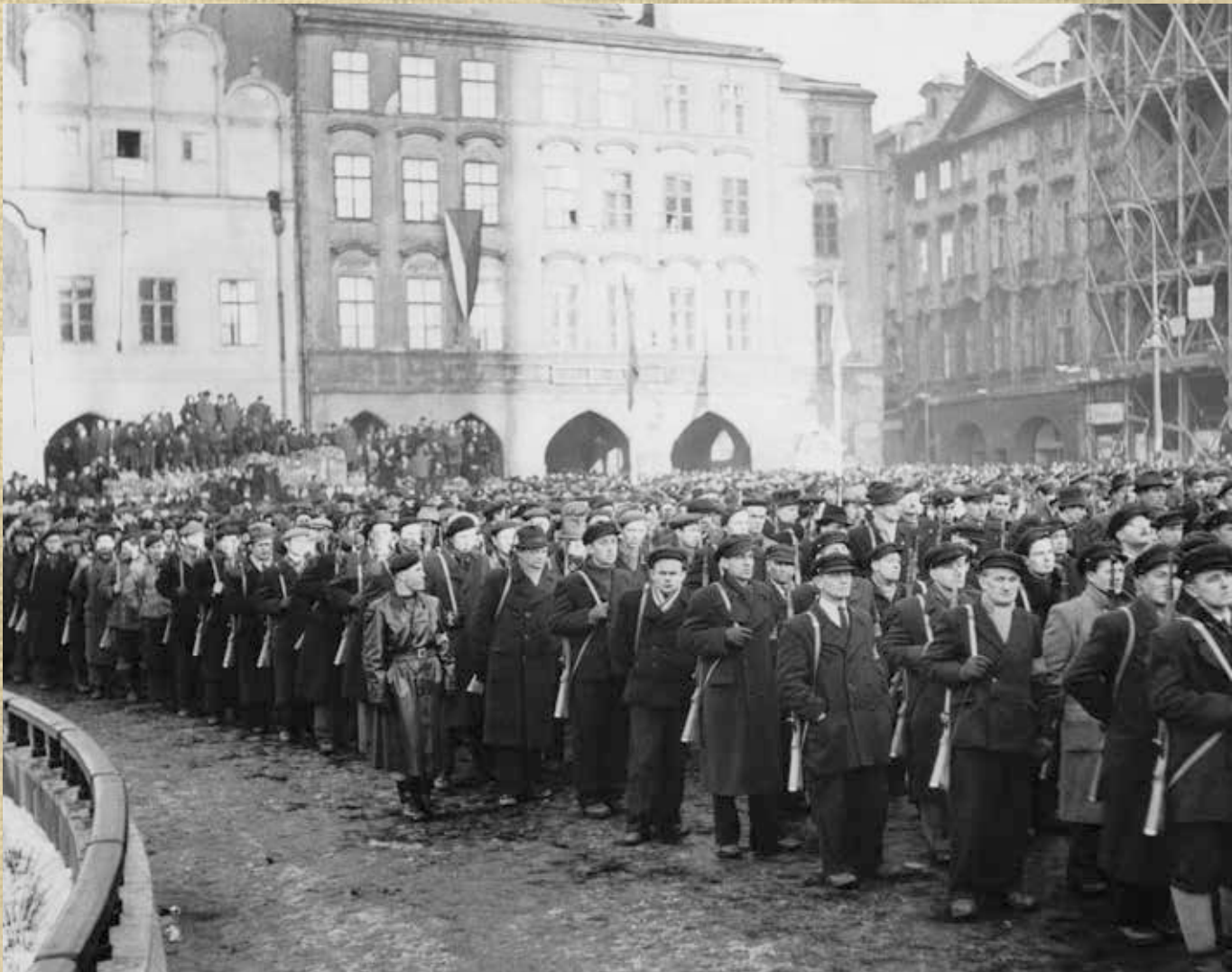
Ozbrojená pěst dělnické třídy. V únorových dnech roku 1948 KSČ iniciovala vznik Lidových milic jako stranické ozbrojené složky. Rozpuštěny byly až po listopadu 1989.

V rámci struktury KSČ fungovaly autonomně slovenské vnitrostranické orgány, včetně vlastního ústředního výboru a Komunistické strany Slovenska (KSS). Naproti tomu české stranické orgány nikdy neexistovaly.