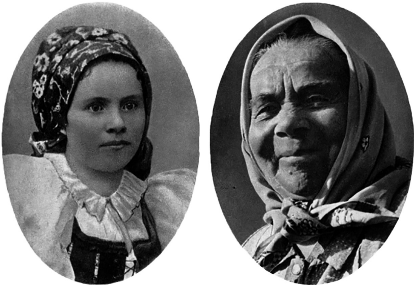
Matka Klementa Gottwalda zamlada a ve stáří.