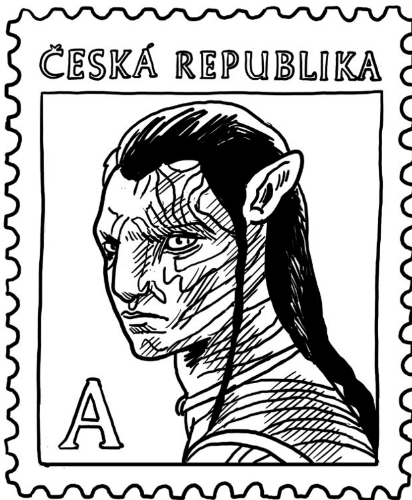
Meziplanetární mise objevila známky existence Avatarů na poště v Praze 4-Nuslích.