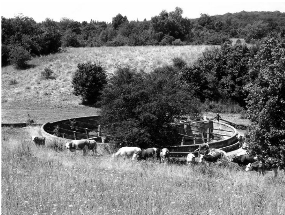
Serényi kút, dnešní stav (Plešivecká planina, Slovenský kras).

Antropocén přicházel někdy v postupných a jindy náhlých krocích, jakými bylo vyhubení velkých savců na konci poslední ledové doby, vypalování lesů mezolitickými populacemi, neolitická proměna krajiny, velkoplošné pěstování rýže v jihovýchodní Asii (které zvýšilo koncentraci metanu v atmosféře), renesanční výroba kovů a skla spjatá s masivním odlesňováním, pokles světové populace kolem roku 1610 apod. Tyto kroky postihovaly různé oblasti nestejnou intenzitou. Neměly jen destruktivní charakter, v mnoha případech naopak vytvářely mozaiku stanovišť, které přírodu obohacovaly. O posledních přibližně dvou desetiletích se hovoří jako o „velkém zrychlení“, při kterém se rychlost mnoha procesů neodhadnutelně zvyšuje. Atmosférický chemik Will Steffen, dřívější spolupracovník P. Crutzena, navrhuje jako počátek velkého zrychlení rok 1950, klimatologové spíš uvažují o letech 1995–2005 či o jiných předělech. Z důvodů mileniální jednoduchosti budeme za počátek velkého zrychlení považovat období po roce 2000.