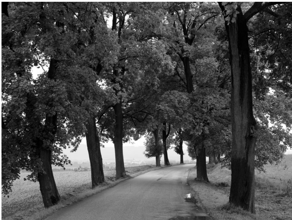
Alej u Broumova se jednak hodí k okolním barokním kostelům, ale také člení krajinu na menší celky. Silnice vybudované na starých cestách krajinu dělí přirozeným způsobem, protože i cesty procházely přirozenými hranicemi.

může stát, že srážková voda proniká snadno do jeskyně, teprve zde se sytí oxidem uhličitým a krápníky koroduje místo toho, aby je srážela. V obou případech představuje udržení správného mikroklimatického systému nezbytnou podmínku zachování lokality.