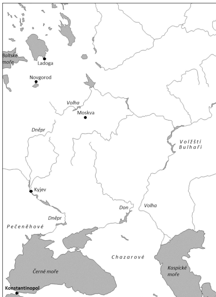
Mapa 1. Východní Evropa (10. století) (lokace zmíněné v textu)

kteřou získávala od Slovanů v rámci mocensky kontrolovaného obchodu (Findlay a O'Rourke 2007: 78–80). Postupně se stejně jako jiní nájezdníci a uzurpátoři ruští Vikingové začlenili do místní populace a asimilovali s ovládaným slovanským obyvatelstvem. Příliv stříbra do západní Evropy – výměnou za reexportované železné zbraně z Francké říše – pomohl monetizovat západoevropskou ekonomiku (příkladem je měnová reforma Karla Velikého v roce 794), a je tak možné tvrdit, že severské kontakty s islámským světem přes Dněpr, Don a Volhu měly v důsledku pozitivní vliv na vývoj Evropy v 9. a 10. století.