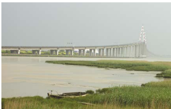
záliv s novým mostem

Bretaň je kraj spjatý s mořem, jež ho z větší části obklopuje. Možná právě proto nazval František Kožík tento nejzápadnější region Francie „Dcera oceánu“. Má rozlohu přibližně 30 000 km 2 , je o něco málo větší než Morava. Je to území, které se tak trochu vymyká představě, již o Francii všichni máme, jako by ani k Francii nepatřilo. I přírodní podmínky jsou tu odlišné. Často tu prší a fouká vítr, který bičuje společně s Atlantikem divoké skály. Hodně slunce, teplé moře, v letních měsících nekonečné řady automobilů s turisty, to tu zkrátka nenajdeme. Bretaň je středně rozvinutou oblastí Francie. Z celkového počtu 60 milionů obyvatel celé Francie tu žije pouze něco málo přes tři miliony. Přesto se jedná o 4. nejnavštěvovanější oblast Francie. Proč tomu tak je, to se určitě během našeho putování dozvíme.