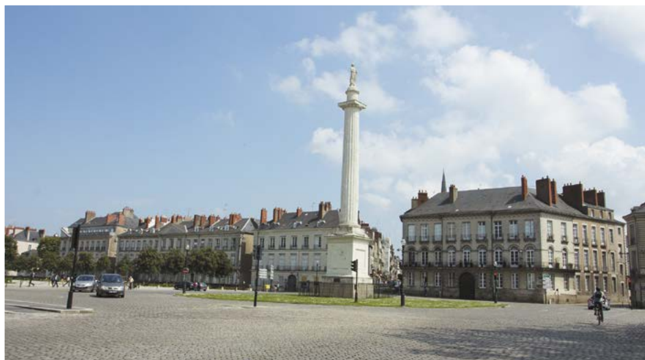
náměstí v Nantes

Naším cílem je objevování Bretaně, ale přesto nemůžeme opominout město a další zajímavé lokality, které dnes už do oblasti Bretaně administrativně nepatří. Znaky Bretaně jako vlajka a jiné se používají na celém území od Brestu po Nantes, jež reprezentuje Bretaň jako historickou, kulturní a tradiční a v minulosti byly s její historií pevně svázány. A jako první zmíníme Nantes , město, které bylo od 11. do 18. století správním střediskem Bretaně. Postupem času při různých administrativních změnách bylo v roce 1941 přeřazeno do regionu Pays de la Loire. Dodnes se místní obyvatelé pyšní tím, že město je vstupní branou do Bretaně. V minulosti k Bretani patřil ještě departement Loire-Atlantique, jehož dnešní hlavní město Nantes bylo hlavním městem Bretaně. Dnes je centrem Bretaně město Rennes. K rozdělení provincie na dva regiony – Bretaň a Pays de la Loire – došlo bohužel kvůli vzájemné rivalitě obou měst. Mnozí obyvatelé „staré“ Bretaně s tím však dodnes nejsou spokojeni a v roce 1980 založili organizaci Bretagne Réunion, která neúnavně usiluje o opětné začlenění města Nantes a celého departementu Loire-Atlantique do Bretaně. Proto také naše putování začneme právě v tomto departementu.