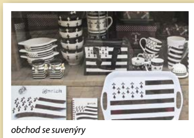
obchod se suvenýry

Je to černobílá vlajka „Gwenn ha Du“, která byla vytvořena v roce 1923. Pět černých pruhů symbolizuje stará biskupství: Dol, Nantes, Rennes, Saint-Malo a Saint-Brieuc. Čtyři bílé pruhy představují kraje Dolní Bretanë, kde byly dříve biskupské oblasti: Trégor, Leon, Cornouaille a Vannes. V levém horním rohu je jedenáct černých hranostajích ocásků na bílém podkladu. Někde se uvádí, že představují bretaňské vévodů. Hermelin je heraldický symbol, který se v Evropě vyskytuje už od pradávna. Zpravidla se zobrazuje jako kříž se třemi výstupy směrem dolů. Původně byl používán na výzbroji vévodů z Montfortu, postupně se změnil na hlavní charakteristický znak bretaňské symboliky. Dnes se vyskytuje ve znacích většiny měst. Můžeme ho vidět také na vývěsních štítech obchodů, které prodávají místní zboží, a na etiketách typických bretaňských suvenýrů.