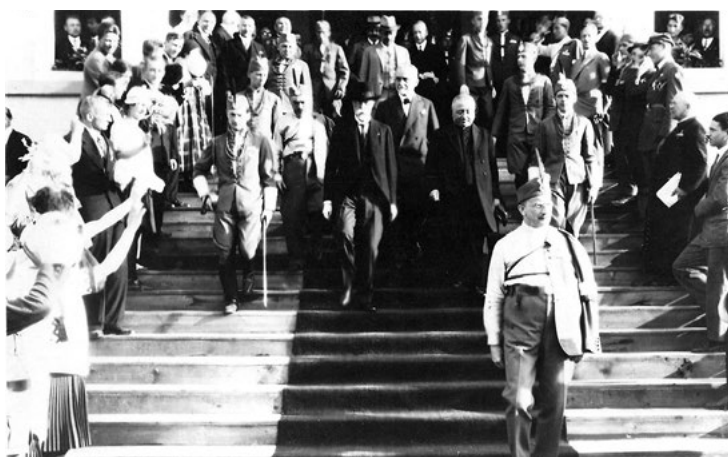
Tomáš Garrigue Masaryk na Václavském náměstí v Praze, 1929