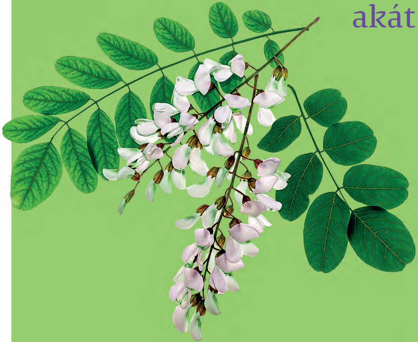
fig. 1 Robinia pseudoacacia Trnovník akát