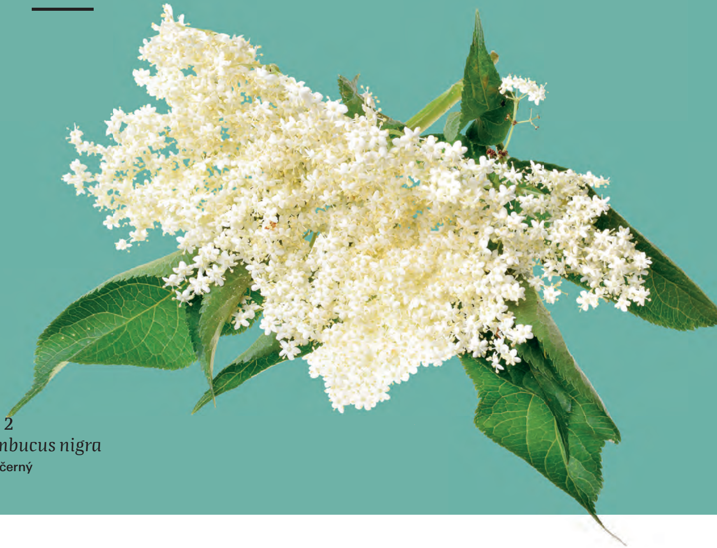
fig. 2 Sambucus nigra Bez černý

baza, bazičky, bez domácí, bez psí, bez smradlavý, beza, bezinka, bezinky, bezová duše, bezoví, bezový květ, bílý bez, bílý květ, blivánky (na Vysočině), bzí, bzina, bzinčí, bzíní, bzinky, černá bezinka, černá bzinka, černý bez, čertův strom, dryáda, ellhorn, habzina, habžina, hulák, hular, hural, chebdový keř, chabza, chabzda, chabzdě, chebdový květ, chebst, chebz, chebzí, chebzík, chebzinky, chebzový květ, chebži, kalina, kašička, keř čarodějný, kobzina, kobzinky, kosmatice, kozíček, kozička, kozičky, kozinky, Lady Elder, píšťalkový strom, psí bez, psí víno, psí víno léčivé, psounský bez, pukač, rostlinná apatyka, smradinka, smradinky, smradlavka, smradlavý bez, strážní strom, strom velké bohyně, strom víl, zebzový květ