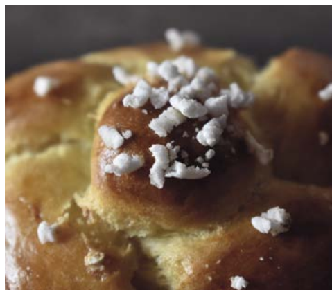
Granulovaný cukr na pečivu