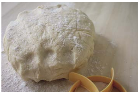
Nejobyčejnější slané těsto se sádlem