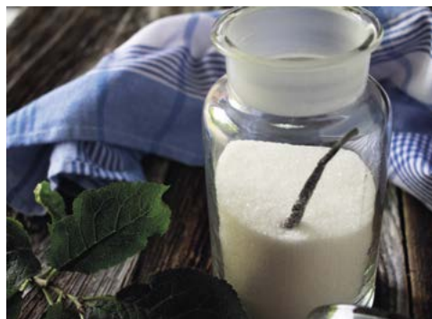
Domácí vanilkový cukr

1,5–2 měsíce louhování bude v láhvi velice voňavý domácí vanilkový extrakt vhodný do sladkých moučnicků, náplní, zmrzlin. Po odebrání části tekutiny je možné vodu do láhve doplnit a znovu nechat aromatizovat.