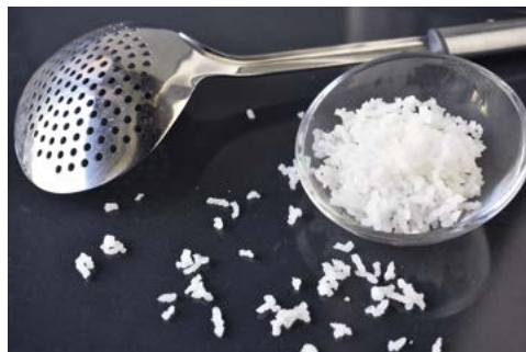
Domácí granulovaný cukr