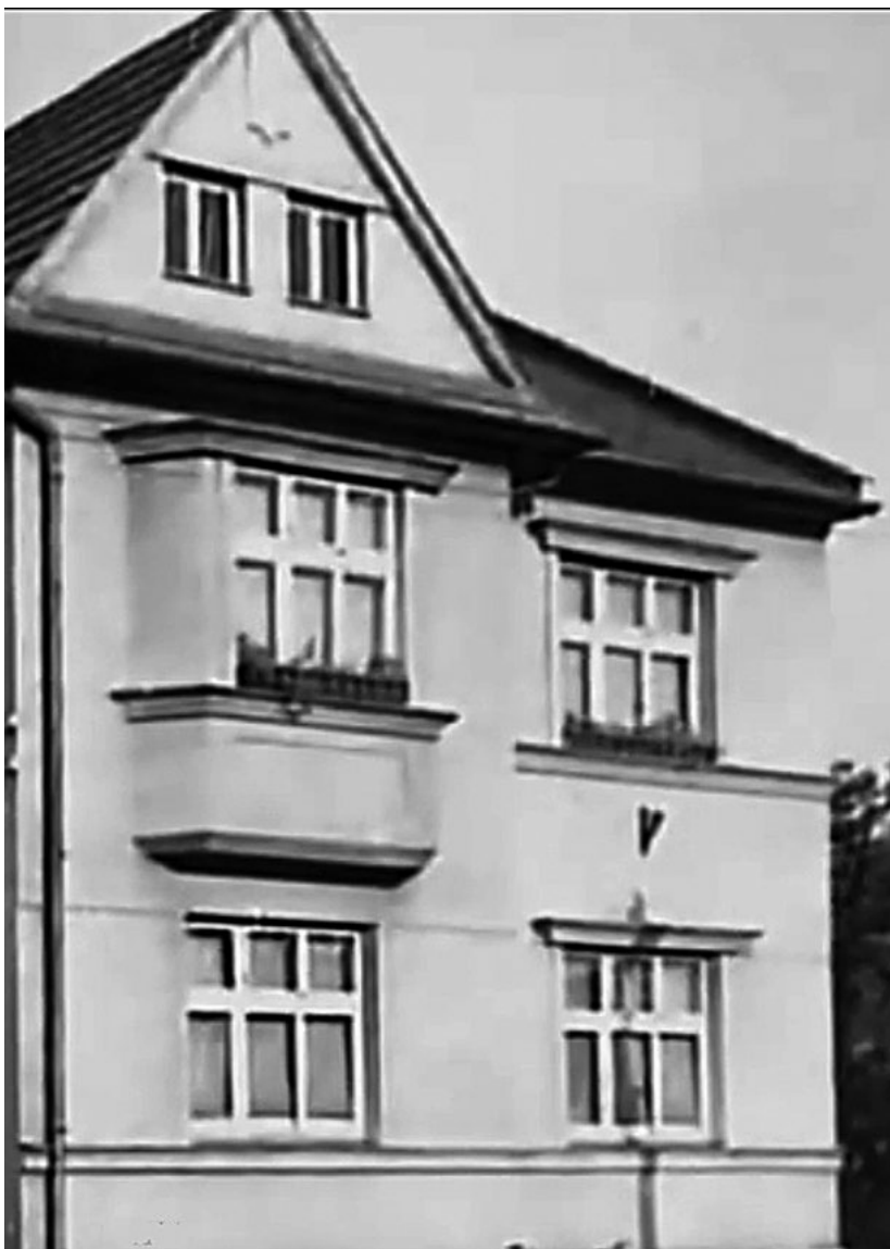
Dům v Uherském Hradišti v Šafaříkově ulici, kde malý Miki vyrůstal