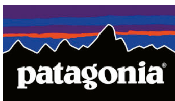
Obr. 1.4 Logo firmy Patagonia

Jako příklad může sloužit firma rychlého stravování, která se rozhodne vyvážit svůj jídelníček větší nabídkou salátů a čistě přírodních surovin, aby přispěla ke zdraví lidí. Změní jednu ze základních barev na zelenou a potlačí agresivní červenou. To pomůže zaměstnancům i dodavatelům pochopit změnu i závazek. Pomůže zákazníkům rozpoznat, že se něco mění. Ale beze změny samotného produktu či služby by se taková změna identity zajisté obrátila proti firmě. Globální značky se díky síle své identity stávají předmětem lásky i nenávisti, podle toho,