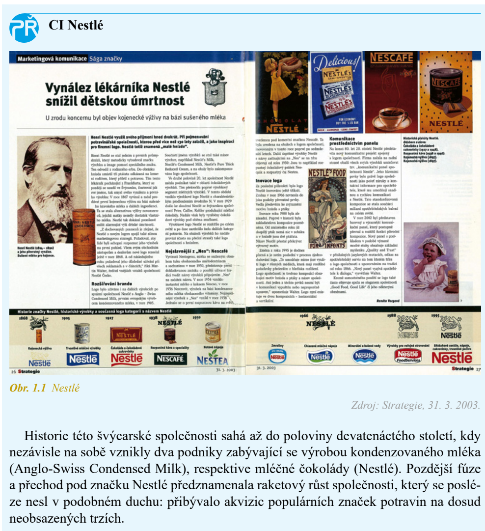
Obr. 1.1 Nestlé

Jednou jsem byl pozván na závod F1 do Monte Carla. Projížděl jsem autem Francií a viděl mohutnou venkovní reklamu na značku Marlboro – ve Francii, která již tehdy nesmlouvavě zakázala jakoukoliv reklamu na tabákové výrobky. Na venkovních reklamách nikde nebyl název cigaret, jen kontura rudé a bílé barvy z jejich obalu. Všichni věděli, o koho jde. Auta jedoucí v těchto barvách tehdy slavně zvítězila. Vizualní identita může tedy mít i zkratkovou podobu. Chce to ovšem dlouhodobě investovat. Nadnárodní firmy doslova válčují národní trhy, ale nemusejí být konečným vítězem – každá akce budí reakci. Reakci na globalizaci je zdírazňování národní identity, koloritu, kultury. Mnozí naši politici si tuto skutečnost neuvědomují. Nebojte se jít do střetu se silnými; i Goliáš byl poražen. Chce to ovšem mít na čem budovat svoji pověst. Základem komerčních komunikací je v každém případě dobře vymyšlený vizuální styl jako součást celkové CI.