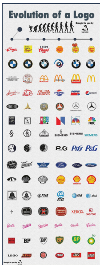
Obr. 1.3 Vývoj loga