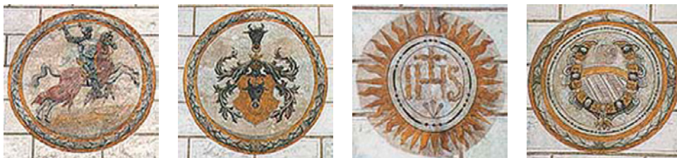
Vývoj znaku města Český Krumlov