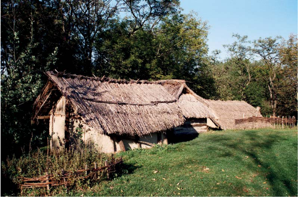
Skanzen v Březně

z Doupovských hor ke Krušnohoří, stejně tak cesty do středních a západních Čech.