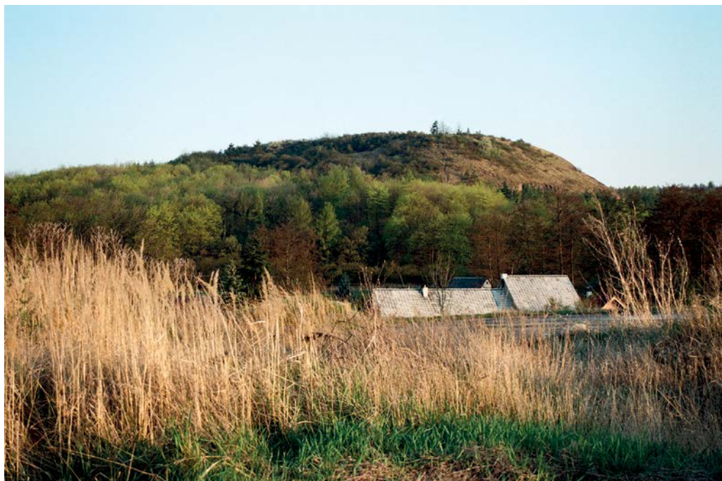
Rubín u Podbořan

vzkázal sebevědomý slovanský náčelník poslovi žádající poddanost avarskému kaganátu (s centrem v Panonii). Vedle toho zejména pohřební nálezy dokládají mírové soužití obou etnik a též vzájemné oboustranné ovlivňování a prolínání jejich kultur.