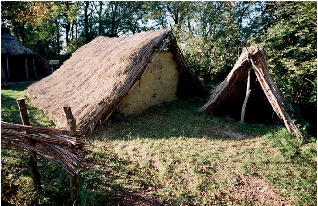
Skansen prvních Slovanů v Březně u Loun

Tohoto roku [631] Slované, zvaní Vinidové, povraždili v Sámově království frankké kupce s četnějším doprovodem a oloupili je o majetek a to byl počátek rozepře mezi Dagobertem a Sámem, králem Slovanů. I vyslal Dagobert k Sámovi vyslance Sicharia se žádostí, aby přikázal poskytnout spravedlivou náhradu za kupce, které jeho lidé povraždili nebo jejichž majetku se protizákonně zmocnili. Protože Sámo nechtěl Sicharia spatřit a nedovoloval mu, aby k němu přišel, oblékl si Sicharius šat, jaký nosí Slované, předstoupil se svým doprovodem před Sáma a oznámil mu všechno, co měl uloženo. Ale jak to bývá znakem pohanství a zpupnosti neslechetných lidí, Sámo nedal náhradu za nic z toho, čeho se jeho lidé dopustili, a chtěl pouze stanovit soudy pro tyto a jiné spory, které vznikly mezi oběma stranami, aby bylo navzájem uplatněno právo. Sicharius – jako pošetilý vyslanec – pronese potupná slova, která mu nebyla uložena, a hrozby proti Sámovi, že totiž Sámo i lid jeho království jsou Dagobertovi povinni poddanstvím. Sámo, již uražen, odpověděl: „Jako země, kterou máme, patří Dagobertovi, tak i my jsme jeho, pokud jen bude mít v úmyslu zachovávat vůči nám přátelství.“ Sicharius řekl: „Není možné, aby křesťané a sluhové boží mohli uzavřít přátelství se