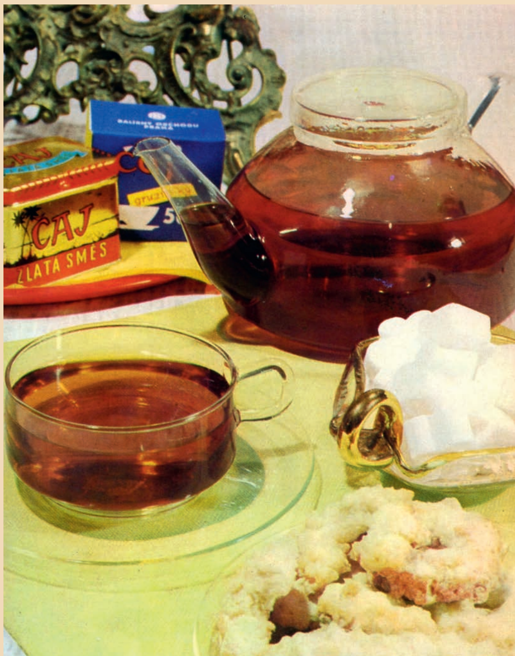
Legendární Zlatá směs se prodávala v nezapomenutelné kovové krabičce.