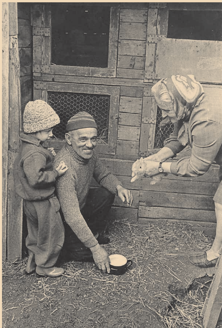
Chovali se králíci, slepice, husy, kachny, holubi.