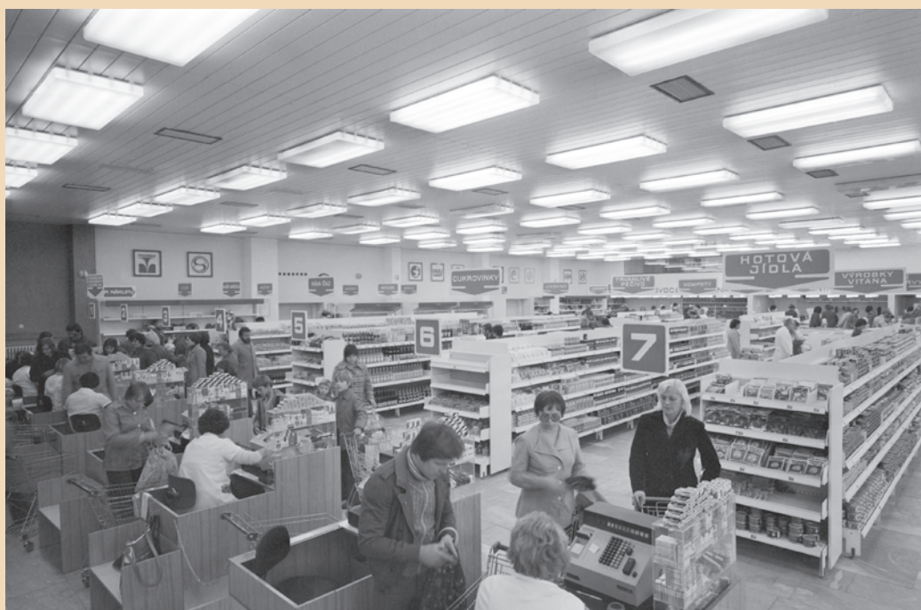
Samoobslužná prodejna Odra v Ostravě Výškovicích.