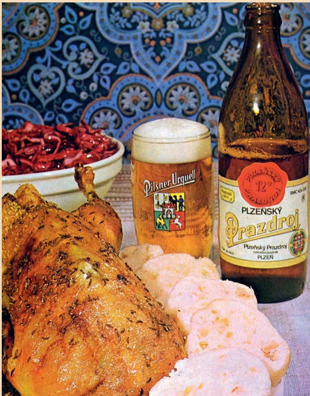
Plzeňský Prazdroj byl oblíbený už v dobách minulých.