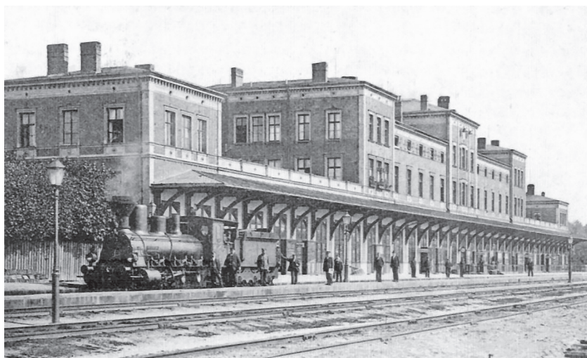
Ašské nádraží na začátku dvacátého století

Ašské nádraží nesoucí jméno Bavorské bylo výstavné, živé a důležité.