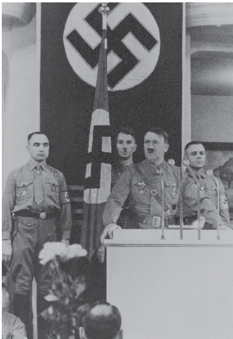
Hitler v Měštánské pivnici v Mnichově roku 1938. Za ním Blutfahne („krvává zástava“), kterou třímá Jakob Grimminger, jeho zvláštní doprovod. V roce 1944 prapor zmizel a už se nenašel.