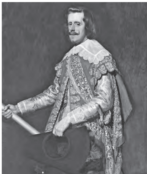
Filip IV. (Diego Velázquez 1559-1660)