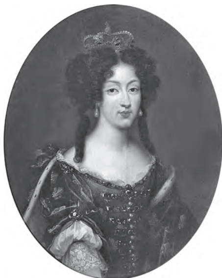
Marie Luisa Orleánská, první manželka Karla II. (Francisco Rizi 1614-1685).