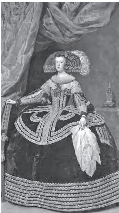
Marie Anna, druhá manželka Filipa IV. (Diego Velázquez 1559–1660)

Syn Don Balthasar Carlos, který se narodil roku 1629, zemřel ve věku 16 let, a dcera Marie Tereza (1638–1683) se později stala manželkou francouzského krále Ludvíka XIV. (1643–1715), jemuž roku 1661 porodila syna, následníka francouzského trůnu Ludvíka (1661–1711).