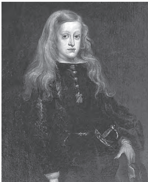
Karel II. Jako dítě (Juan Carreño de Miranda 1614–1685)