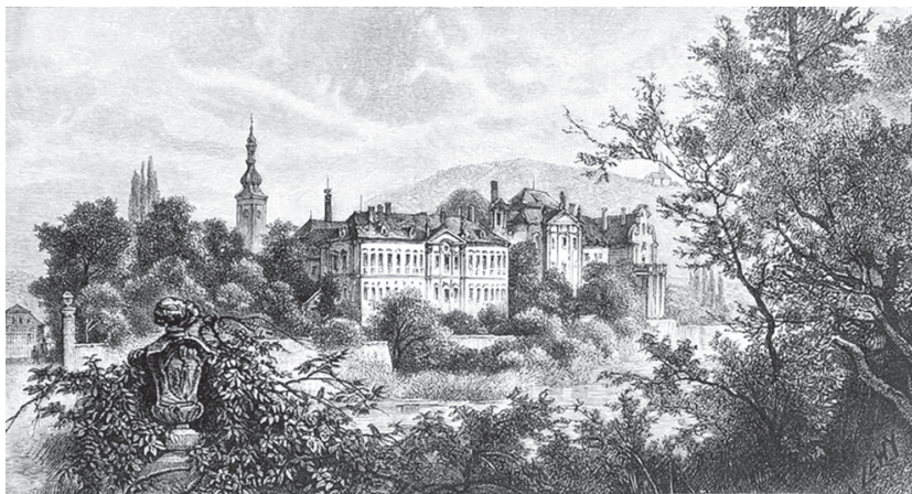
Takhle vypadal Zbraslavský klášter na konci 19. století

aby svému nástupci, budoucímu Václavu III., usnadnil začátek vlády – přece jen to byl teprve nezkušený chlapec. Oba muži, otec a syn, byli z dnešního pohledu velmi mladí a jejich věkový rozdíl činil pouhých osmnáct let. Umírajícímu králi Václavovi bylo necelých čtyřiatřicet, jeho synovi patnáct – a tento syn měl před sebou pouhý rok života, než byl zavražděn.