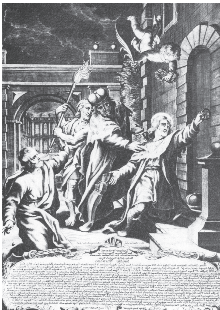
Přibližně o tři století je mladší tato rytina na stejné téma