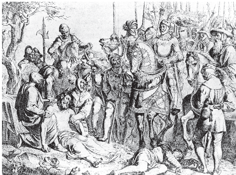
Rudolf Habsburský u mrtvoly Přemysla Otakara II. (kresba Josefa Führicha)

Přemysl Otakar II., známý také jako „král železný a zlatý“, prakticky ztělesňoval dobový ideál panovníka: byl chytrý a pohledný, atletické, středně vysoké postavy, s dobrým vzděláním a rytířským vychováním. Navíc si hlídal příjmy a výdaje, aby se jako mnozí jeho předchůdci a následovníci nedostal do dluhů – odtud pochází i přívlastek „zlatý“, zatímco „železným“ se stal díky silné skupině těžkooděnců, která se vyznamenala v bitvě u Kressenbrunnu, v níž roku 1260 Přemysl porazil početnější uherské vojsko. K jeho oblíbenosti jistě přispěla úspěšná snaha o expanzi; rozšířil svou zemi do nebývalé rozlohy, hranice