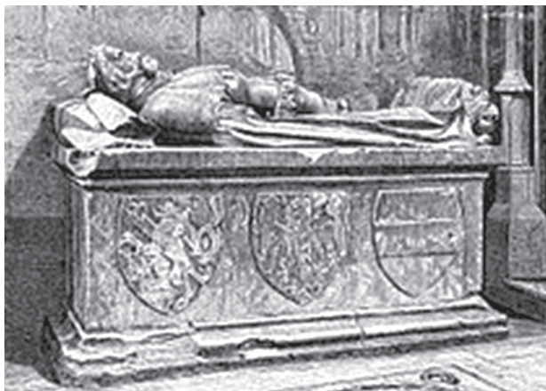
Hrob Přemysla Otakara II. v Saské kapli Svatovítského chrámu

vala jeho pohřeb do posvěcené půdy. Provizorně bylo uloženo ve znojemském klášteře a teprve roku 1296 je Václav II. nechal pohřbit v Anežském klášteře. Roku 1373 byly exhumovány Karlem IV. a přeloženy do nového hrobu v chrámu sv. Víta na Pražském hradě, a to pod krásný opukový náhrobek z dílny Petra Parléře.