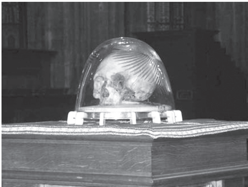
Lebka sv. Vojtěcha ve Svatovítském chrámu

a kritizoval všechny pohanské a nekřesťanské přežitky jako otroctví, mnohoženství, incest atp., ale jeho kroky nebyly příliš populární a Vojtěch Prahu opustil, aby se na naléhání o několik let později vrátil a dal rodné zemi ještě jednu šanci; přišel dokonce pěšky a bos jako pravý kajcník. Roku 993 založil Břevnovský klášter, první mužský klášter v Čechách, avšak štěstí mu opět nepřálo, navíc v září roku 995 byla vyvražděna jeho rodina, což jistě jen podpořilo jeho úmysl odejít na dobro.