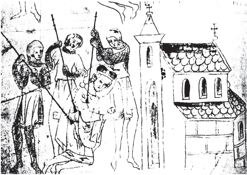
Zavraždění sv. Václava na ilustraci z Velislavovy bible (počátek 14. století)

přemohli a zabili, ačkoliv před nimi chtěl utéct a schovat se v kostele; to se mu nepovedlo, protože i místní kněz byl údajně Boleslavovým spiklencem. Podobně krutý osud pak stihl také Václavovy stoupence a jejich rodiny včetně dětí. Existuje předpoklad, že zavražděn byl i Václavův nelegitimní syn Zbraslav, který mohl připadat v úvahu jako možný nástupce místo vraha Boleslava.