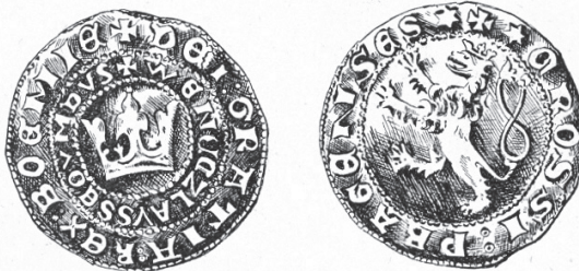
Pražský groš Václava II.

V prosinci roku 1304 se začala králova nemoc, tedy tuberkulóza, ozývat naplno. Trpěl silnými bolestmi, které ještě zhoršoval stres z komplikované politické situace. V posledním období svého života se Václav snažil napravit všechny křivdy, jichž se dopustil, splatit dluhy, vyrovnat se s každým a urovnat konflikty zejména s římským králem,