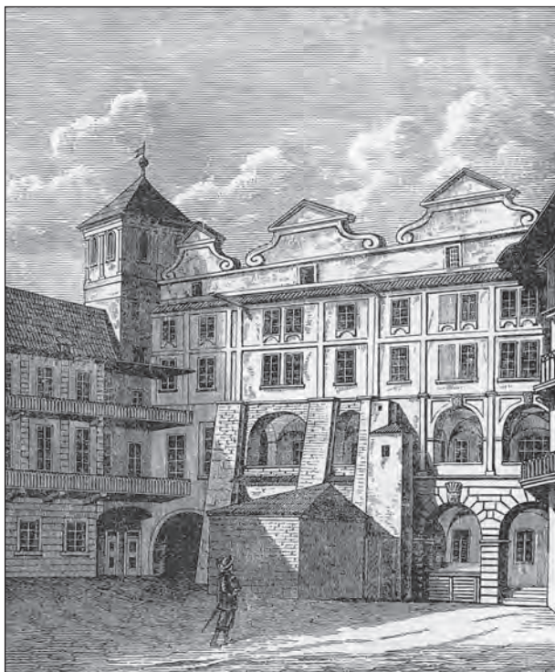
Palác pánů Smiřických ze Smiřic na Malostranském náměstí

Rozsudek smrti nad předními panovnickými rádci a úředníky by znamenal otevřený ozbrojený zápas s vídeňskou vládou, a s tím také hlavní strůjci atentátu kalkulovali. Lze říci, že už cílevědomě připravovali povstání. Bylo rozhodnuto, že na Pražském hradě bude před stavovskou většinou zinscenován s úhlavními nepřáteli krátký soudní proces. Navržena byla i forma potrestání: vyhození rušitelů Majestátu z oken české kanceláře, aby nebyla na místě tak památném prolévána