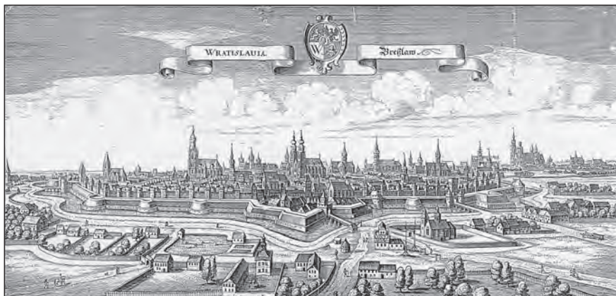
Vratislav, hlavní město Slezska

o bohatou protestantskou zemi, ležící mezi Braniborskem, Saskem a Polskem, s níž obě zneprátené strany a koalice musely počítat, a to buď jako s vážným protivníkem, nebo výhodným partnerem. Na základě dřívějších dohod bylo povinností Slezska, aby v tomto okamžiku odlehčilo české stavovské armádě na vzniklém jihočeském bojišti, ale slezská politická reprezentace toužila po větší míře samostatnosti a chtěla si celou záležitost více promyslet. Největší úlohu zde sehrával Jan Jiří, markrabě braniborský a slezský kníže krnovský, jenž jako první z tamních politiků pozvedl hlas ve prospěch české reformace a protihabsburského odboje. Ostatní knížata však váhala a nechtěla do otevřené války s Habsburky vstoupit.