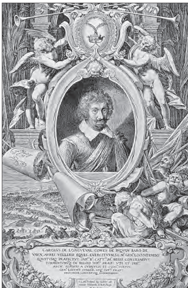
Karel Bonaventura hrabě Buquoy

snažil drobnými akcemi obsadit okolní cesty a důležitá místa, která stála na trasách do Bavorska a Rakouska. Nakonec se mu podařilo ovládnout Český Krumlov, odkud byla vypuzena císařská posádka, která měla kontrolovat tzv. „Zlatou stezku“.