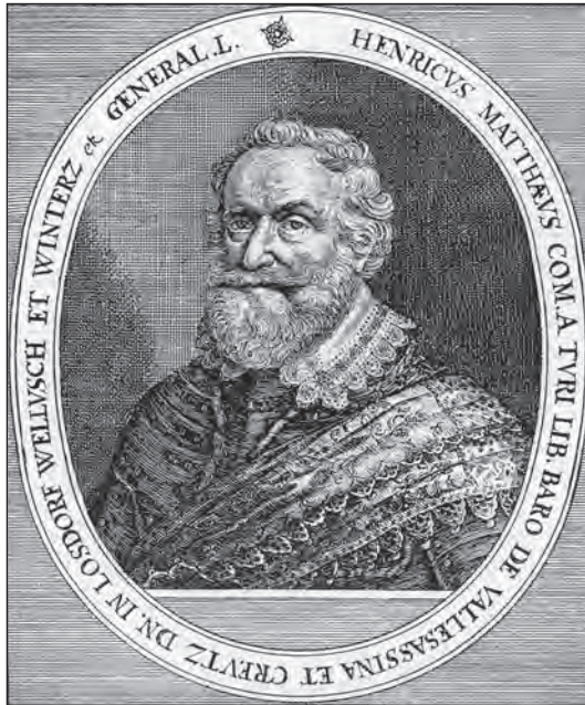
Jindřich Matyáš hrabě Thurn

Znalci těchto státovědných raně novověkých myšlenek jsou označováni jako monarchomachové. Právě oni patřili k hlavním ideologům českého stavovského povstání.