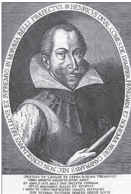
Jindřich Duval hrabě Dampierre

potenciální spojence o vojenskou pomoc. Ve Vídni padla Khleslova vláda a ke slovu se dostala militantní skupina kolem Ferdinanda Štýrského. Ta odmítala jakékoliv mírové snahy a pokládala výbuch povstání za jakési dobrodiní, protože nadešel čas, aby byl „český vřed“ vyoperován silou. Za španělské peníze byly naverbovány dva pluky. K nim se měly připojit domácí císařské jednotky a posily uherských husarů a hajduků. Celkem se po této mobilizaci odhadovala císařská armáda asi na 12 000 mužů. Za velký úspěch však lze považovat zisk