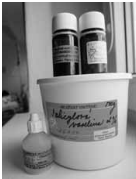
Obr. 1.1 Léčiva magistrality

individuálně vyráběné léčivé přípravky. Bývají uzavřeny ve zvláštních nádobách s identifikačními štítky pro označení léčiva (obr. 1.1).