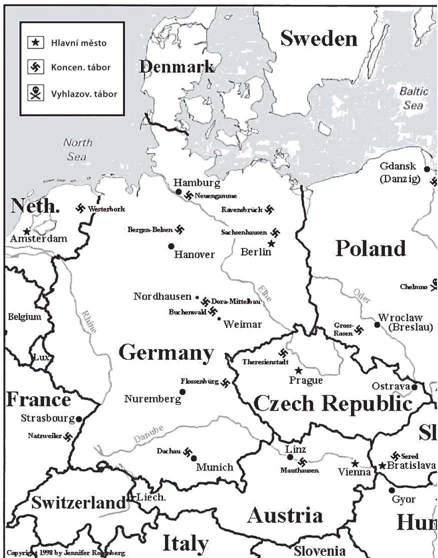
Mapa nacistických vyhlazovacích a koncentračních táborů