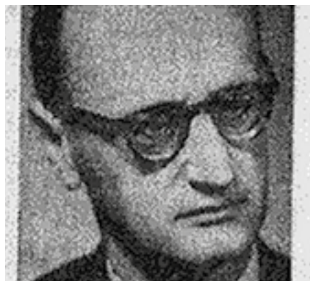
Jiří Hájek byl čsl. ministrem zahraničních věcí v době Pražského jara.