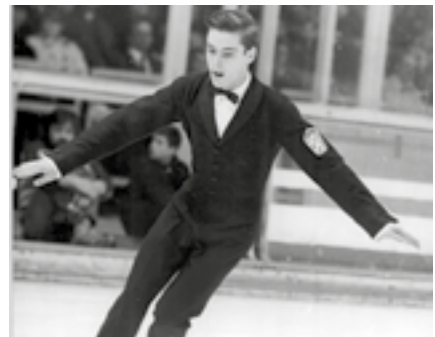
Ondrej Nepela v dobách své největší slávy

V pouhých 38 letech zemřel v západoněmeckém Mannheimu krasobruslař Ondrej Nepela. Nepela se stal v roce 1972 v Sapporu prvním československým olympijským vítězem v krasobruslení. Byl rovněž trojnásobným mistrem světa. Stal se jednou z prvních obětí HIV mezi známými sportovci.