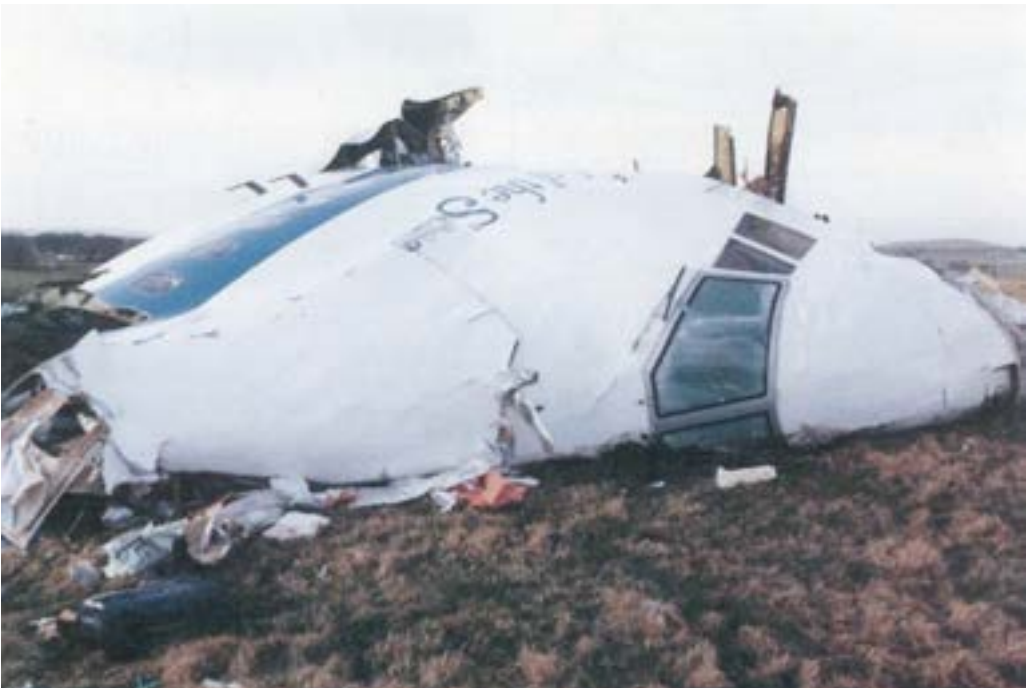
Trosky Boeingu 747 u obce Lockerbie, zdroj: Air Accident Investigation Branch, Open Government Licence v2.0 (OGL)

Ještě na konci minulého roku otrásl Evropou atentát ve skotském Lockerbie, nad nímž explodoval americký Boeing 747 společnosti PanAm. Teprve později bylo definitivně prokázáno, že se jednalo o atentát zorganizovaný pravděpodobně Lybií jako odplatu za americké bombardování země. Pád letadla nepřežilo 270 lidí. Celá tragédie nesla i smutnou československou stopu. Teroristé totiž k odpálení letadla použili československou trhavinu Semtex.