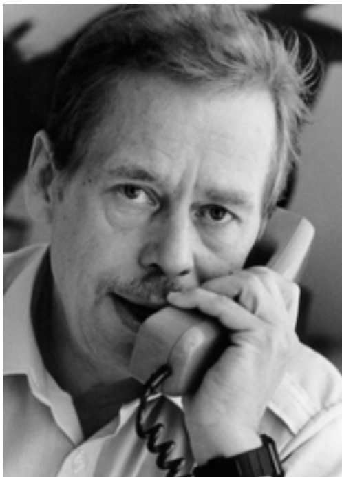
Václav Havel

Američtí kongresmani Dennis DeConcini a Steny Hoyer navrhli Václava Havla na Nobelovu cenu míru. Ve svém zdůvodnění mimo jiné uvedli: „Zatímco v jiných východoevropských státech lze pozorovat podstatný pohyb k větší demokracii, Československo zakouší vlnu represe, jejíž drsnost a rozsah nemají od let 1968–69 obdobu. Ani to však neotráslo Havlovým zaujetím pro mír a lidská práva a jeho kritičností k stavu lidských práv v Československu.“