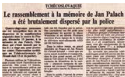
Zásah na Václavském náměstí vyvolal ohlas ve světových sdělovacích prostředcích

Akce na tzv. Palachův týden nepřipravovali chartisté náhodou. Zrovna v těch dnech totiž ve Vídni finišovala následná schůzka Konference o bezpečnosti a spolupráci v Evropě (KBSE). Její závěrečný dokument zavazoval všechny země (včetně ČSSR) k dodržování lidských práv a poprvé definoval i způsob, jakým měly být uplatňovány. Potlačení demonstrací režimem proto vyvolalo ve světě o to větší odpor.