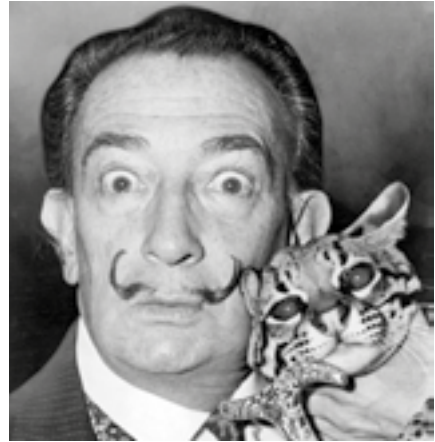
Salvador Dalí

Ve věku 84 let zemřel ve Španělsku na těžký západ plic fenomenální surrealistický malíř Salvador Dalí. Dalí se proslavil excentrickým vystupováním i snovými obrazy s obrovskou dávkou fantazie.