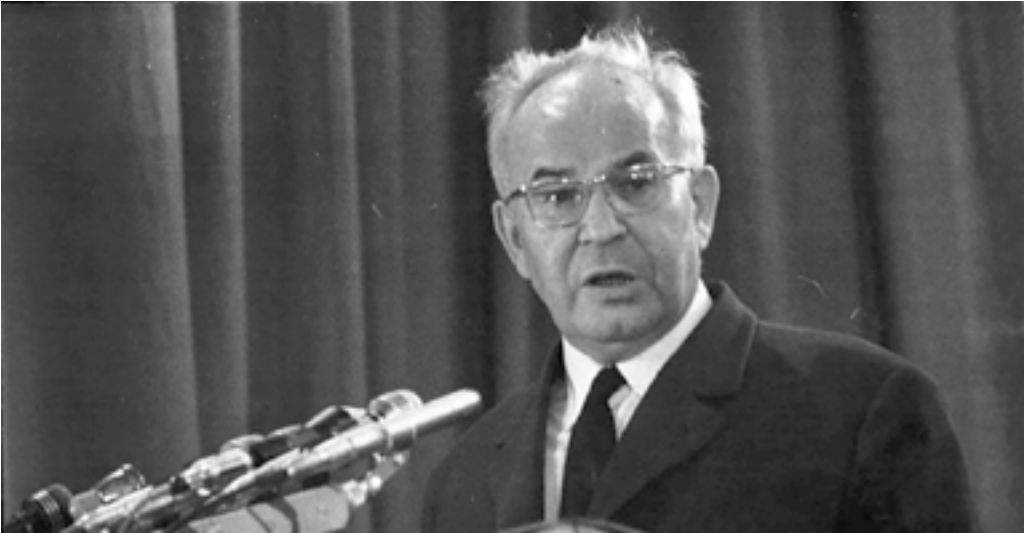
Prezident Gustav Husák

Na samém počátku roku 1989 Československo nijak nepůsobilo dojmem země, v níž by mělo v nejbližší době dojít k zásadním změnám. Navzdory Gorbačovově politice perestrojky (přestavby) a glasnosti (uvolňování) zůstávaly v ČSSR u moci normalizační struktury, jejichž rigidnost se dala srovnat snad pouze s Honeckerovou NDR. Křídlo zastánců Gorbačovovy perestrojky a ekonomických změn svůj boj definitivně prohrálo v říjnu 1988 odchodem Lubomíra Štrougala z pozice předsedy federální vlády. Řeči o přestavbě a změně stylu tak zůstávaly pouze prázdnými frázemi. V čele republiky stál nadále normalizační prezident Gustav Husák, post generálního tajemníka ÚV KSČ (nejdůležitější mocenskou funkci) zastával Milouš Jakeš. Jedinou alespoň částečně umírněnou postavu v nejužším vedení představoval nový premiér Ladislav Adamec.