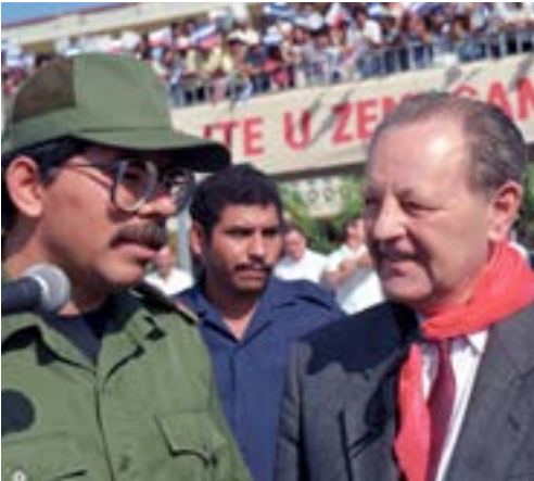
Miloš Jakeš a Daniel Ortega

nec k uspořádání polosvobodných voleb a postupnému přechodu v demokracii.