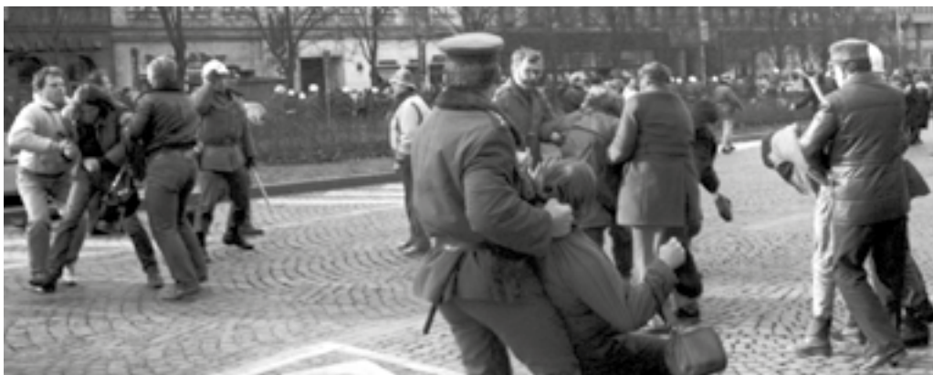
Policijní zásah na Václavském náměstí 15. ledna 1989