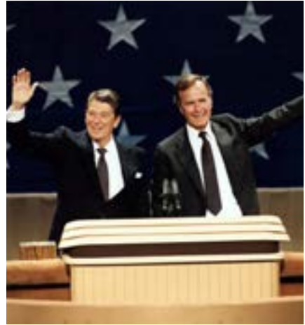
George Bush (vpravo) nahradil ve funkci Ronalda Reagana

Republikán George H. W. Bush byl 20. ledna inaugurován 41. prezidentem Spojených států amerických. Do té doby působil jako viceprezident Ronalda Reagana.