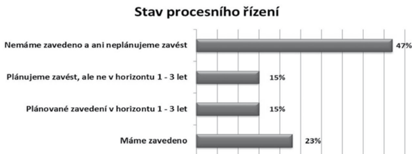
Obrázek 1.2 Stav procesního řízení ve veřejné správě ČR a SR

Další z realizovaných průzkumů byl Průzkum stavu procesního řízení ve veřejné správě ČR a SR , realizovaný Václavem Řepou z katedry informačních technologií Vysoké školy ekonomické v Praze 7 . Z průzkumu vyplynulo, že stav procesního řízení v úřadech odpovídá stavu na obrázku 1.2.