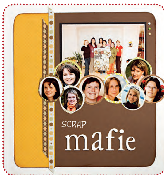
Autorka: Dagulka (podle Emily Ahern)

Vynásobte si to devíti a máte nás – ScrapMafiánky. Společný máme jeden krásný koníček a pojí nás ještě krásnější přátelství. Rozdílné máme povahy i zázemí – matka se třemi dětmi a náročnou prací i studentka vstupující do dospělého života, puntičkářské, chaotické, více či méně kreativní – scrapbook je zkratka pro každého.