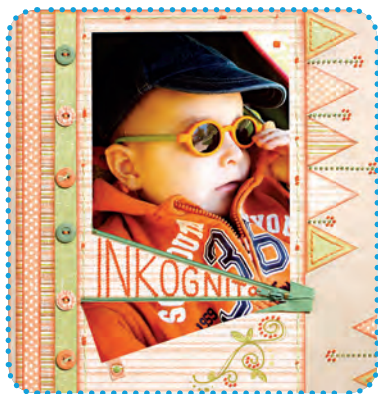
Vítězná stránka challenge Trojúhelník Autorka: Ivik

Do češtiny se dá přeložit jako „výzva“, ale běžně se používá anglický tvar. Vyhlášvatelka zadá téma nebo podmínky, které by neměly být úplně snadné a jednoduché. Podmínkou může být specifická barva nebo prvek, počet, velikost a tvar fotografií nebo specifická ozdoba. Další možností jsou abstraktní podmínky typu hudba, citát, roční období, chlapi, dokumentace nějaké příhody atd. Záleží pak na každém, jak podmínku pojme a popere se s ní. Challenge trvá nějakou předem určenou dobu, stránky se zasílají vyhlášvatelce a ta je v daný čas hromadně zveřejní. Po zveřejnění stránek probíhá tajné hlasování o nejlepší splnění podmínek.