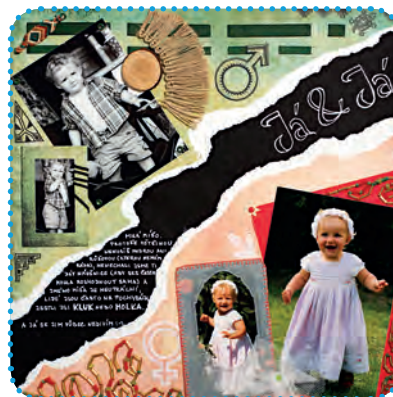
Vítězná stránka challenge Kontrast Autorka: Astarte