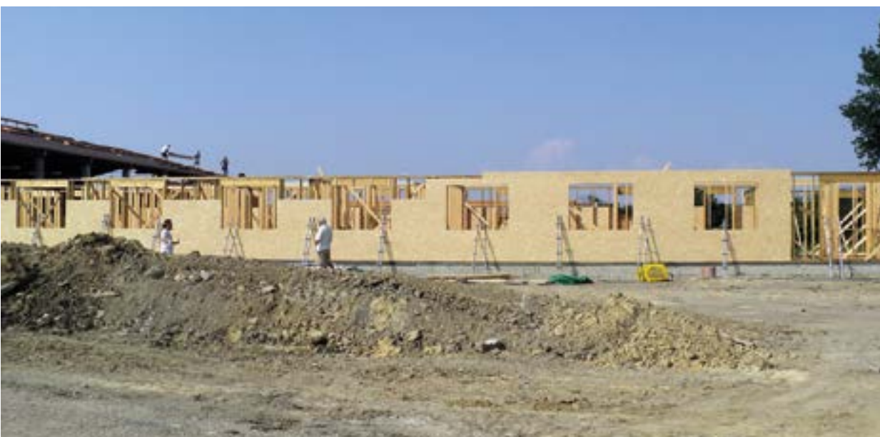
Obr. 1.1 Základní fošnová konstrukce TBF, na horním obrázku zatím bez opláštění deskami OSB. Deskový ztužující efekt nahrazuje provizorní diagonální zavětrování. Na pravém obrázku se opláštění provádí z vnější strany a spolu s rámem stěny.