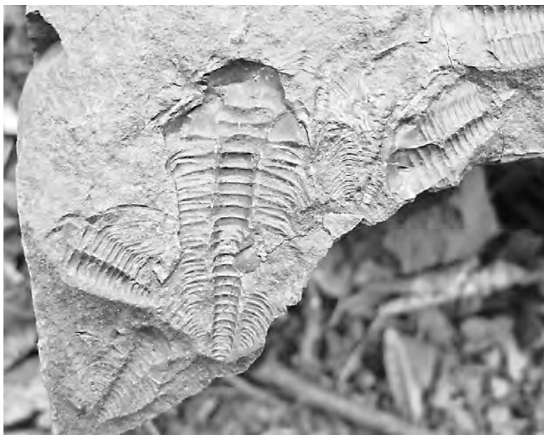
Tento trilobit po stráni Vinice už nedolezl, zkameněl

V dávných časech tu ani bory nešuměly, ale místo Brd se rozkládalo veliké sladkovodní jezero. Když se různými pohyby půdy spojilo s mořem, rozmohl se v něm život. Z mnoha druhů živočichů se však proslavil jeden, do jisté míry předchůdce dnešního raka, který stále ještě obývá některé čistší vodní toky. Tehdy, před 570 miliony let, však žádný ekologický problém