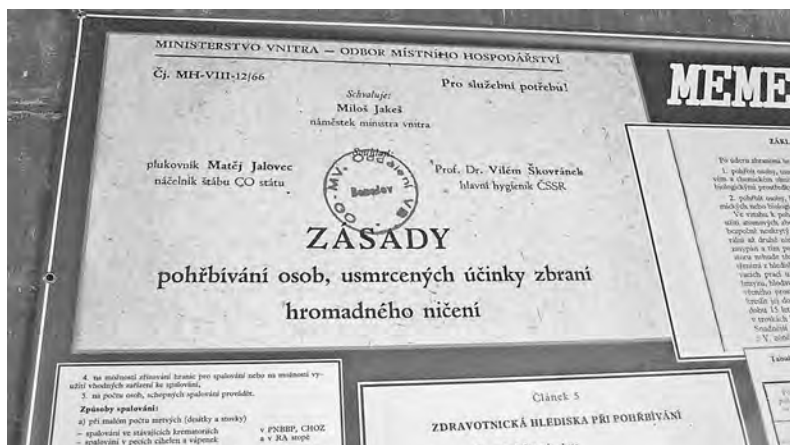
Miloš Jakeš pohřbil víc než osoby – celý režim

Nejsme v márnici, jak by se snad mohlo zdát z těchto dokumentů. Kolem nás šumí brdské lesy, nad námi svítí slunce, nic