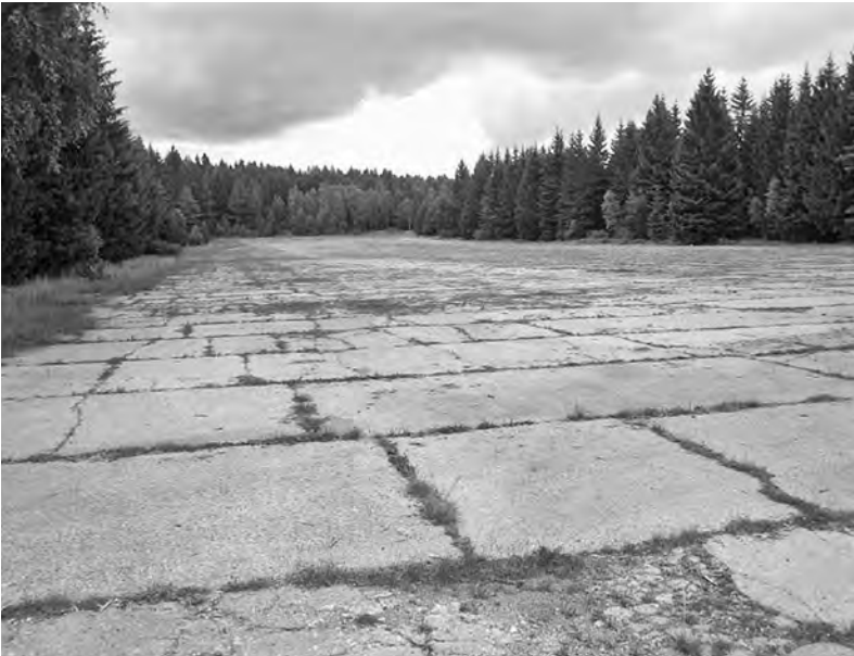
Letiště Hejlák. Mezi posledními tu přistáli Američané.

Nyní by tu ovšem nemohla jako poustevnice žít. Na Hejláku je vojenská pozorovatelná, odkud vojáci kontrolují, kam dopadají dělostřelecké náboje na cvičnou plochu Jordán. Asi čtyři sta metrů od ní byla letištní plocha, kterou využívali za války Němci. Dnes plocha slouží jako seřadiště vojenské techniky.