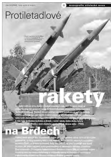
Protiletadlové rakety na Brdech

na Závisti poblíž Zbraslavi. Ale ty dva kopce, na nichž vybudovali své oppidum po obou stranách Břežanského údolí, které také dělí vlastní pražské území od nepražského, již k Brdům nepatří. Škoda, Brdy se mohly pochlubit největším keltským sídlištěm ve střední a snad v celé Evropě. Vždyť tu za dvojími obrannými valy žilo několik tisíc stálých usídlenců a ještě tu bylo místo pro