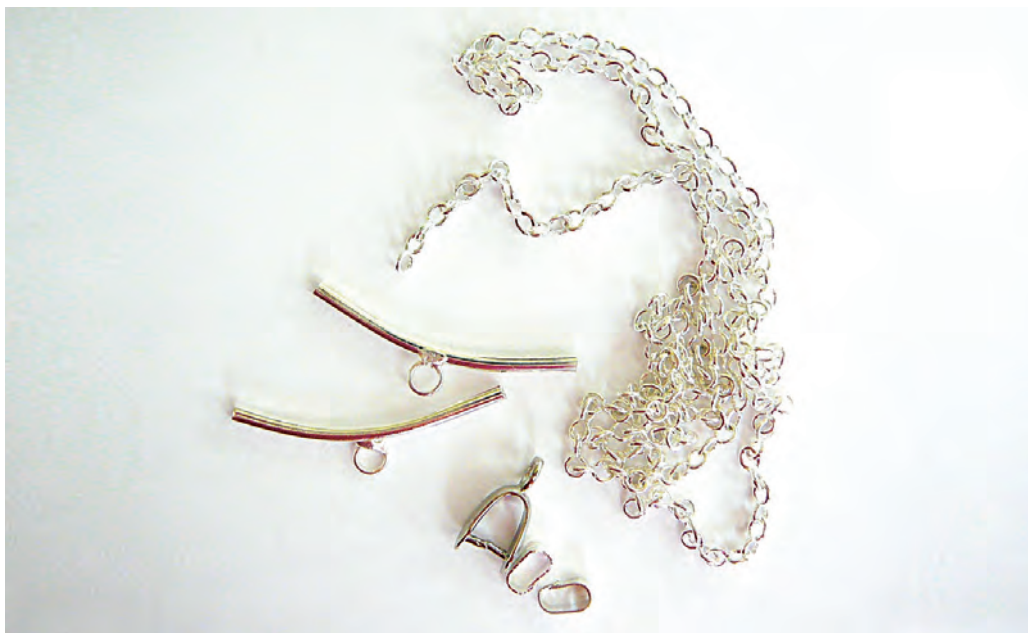
Na fotografii je postříbřený řetěz, trubička s očkem a šlupny

Rovněž budete potřebovat zapínání podle vaší fantazie – karabinky s protidíly, dvoudílné americké záponky (velké očko a protidíl – kolíček), kovové kroužky, kaloty, zamačkávací rokajl... Tyto komponenty běžně zakoupíte v kamenných i internetových obchodech s korálky a jejich použití, zejména těch méně běžných, si vysvětlíme při popisu jednotlivých projektů.