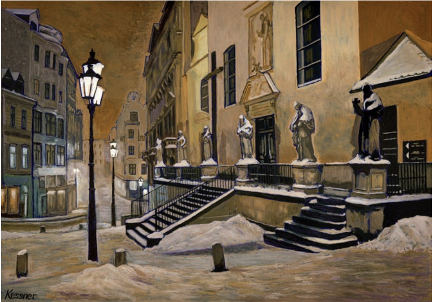
U Kapucínských krypt / Next to the Capuchin Crypt / Bei der Kapuzinergruft