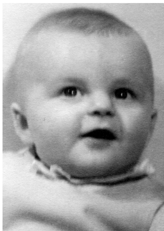
Spokojené mimino (1937)

Starší člověk rád vzpomíná – tedy když na to má čas. Vrací se k tomu, co bylo. A když toho bylo v životě hodně, má dost co dělat. Nedělá to snad jenom kvůli sobě, ale možná chce – jak říká Nietzsche – „zachraňovat minulost“, to jest uvádět na pravou míru to, co se z ní překroutilo, co by se nemělo ztratit. Možná chce dohonit něco, co v té minulosti sám zapomněl, třeba se někomu omluvit nebo poděkovat. Jenže kde tu minulost vzít? Paměť není žádný záznam toho, co se stalo, ale spíš jakýsi pytlík s příhodami a obrázky, které člověka tak nadchly nebo zranily, že mu tam uvízly. Vzpomínky tam ovšem nejsou nasypané vedle sebe, ale žijí vlastním životem, všelijak se mezi sebou ovlivňují a spojují, konfrontují se s tím, co se člověk dozvěděl od