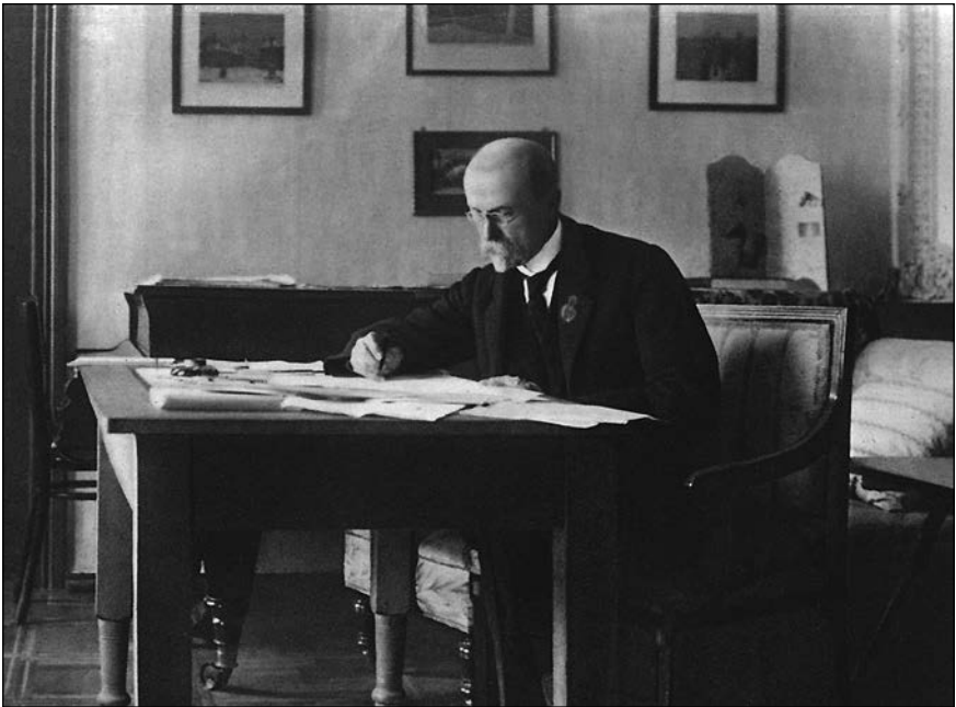
Profesor Masaryk na podzim 1917

prostoru jako by neskončila. A pokud podle vyjádření dohodových států skončila, rozhořela se na moravsko-slovenské hranici válka nová, nikým a nikomu nevyhlášená. Zdálo se, že různé národnostní skupiny, ale především představitelé vídeňského i peštského parlamentu a jim podobní „organizátoři“, chtěli zneužít rozkladu rakousko-uherského císařství i neinformovanosti místních obyvatel bez ohledu na rozhodnutí vítězných států výhradně ve svůj prospěch.