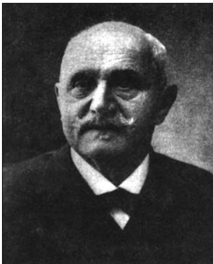
Předseda Slovenské národní rady Matúš Dula

nebezpečí záchranných akcí z maďarské strany spočívalo v tom, že slovenská politická reprezentace se ještě stále oficiálně k žádostem slovenského národa nevyjádřila, členstvo Slovenské národní rady zůstávalo po různých krajích Slovenska organizačně nepodchycené, neinformované a širším masám slovenského národa hrozila dezorientace.“ To přesně vystihuje situaci. Zejména tam, kde Maďari organizovali různá prohlášení proti česko-slovenskému státu, především ve městech. Navíc peštská vláda zavedla informační izolaci tím, že zakázala dovoz a distribuci českého tisku. Na venkově žil lid většinou vůbec bez informací o tom, co se v Uhrách či v Evropě děje, natož co se bude či co by se mělo dít.