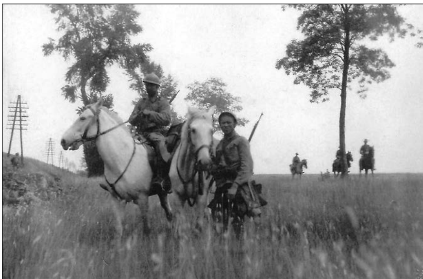
Jízdní hlídka francouzských legionářů na průzkumu

Jako první ovšem překračují slovenskou hranici vojáci náhradního praporu číslo 25 rakousko-uherského střeleckého pluku, vracející se ze St. Pöltenu poblíž Vídně do Kroměříže. Při zastávce v Hodoníně je místní národní výbor žádá, aby přerušili cestu domů a zajeli přes hranici do nedalekého slovenského Holíče a zabránili tam dalšímu rabování.