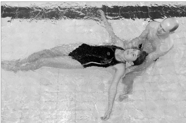
Obr. 6 „Vyvlávním“

Činnosti můžeme provádět samostatně, ve skupině může být program pestřejší, s plaveckým instruktorem účinnější. Při přetrvávajícím napětí, úzkosti a neuvolnění se při polohování ve vodě postupujeme zvolna. Pokud se nedaří zvládnout změny poloh, je dobré využít pomoci plaveckého instruktora, který umí pomocí kontaktní dopomoci navodit uvolnění ve vodě tzv. vyvlávním (viz obrázek 6).