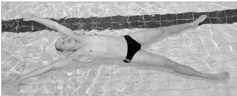
Obr. 2 Hvězdice v poloze na prsou