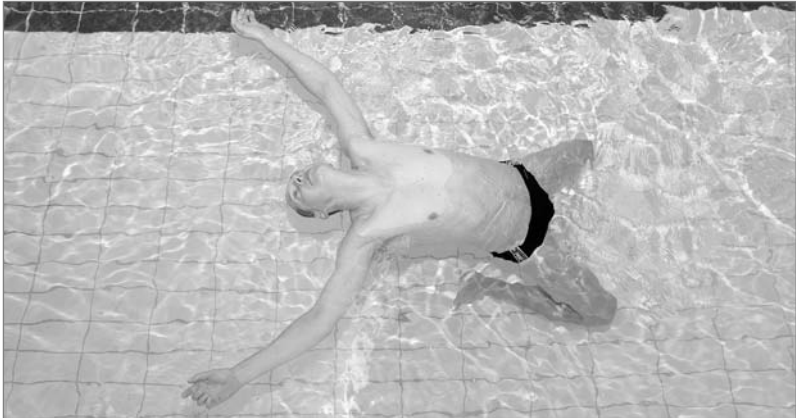
Obr. 4 Vznášení na zádech