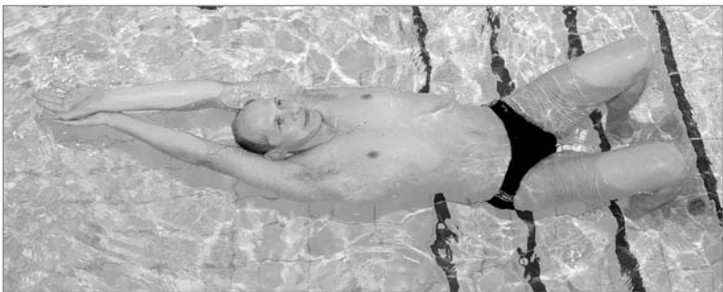
Obr. 5 Splývání na zádech po odrazu od kraje bazénu

Jedním z možných komplexních cvičení, které prověří vaši plaveckou úroveň, je např. skok do vody ze skokanského zařízení – z prkna ve výšce 1 nebo 3 m, nemusí to být ani skok střemhlavý.