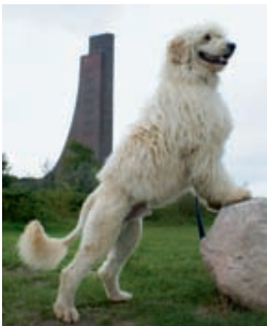
Krátce ostříhaná zád' je také u portugalského vodního psa tradičním účesem, který mu měl ulehčit plavání.