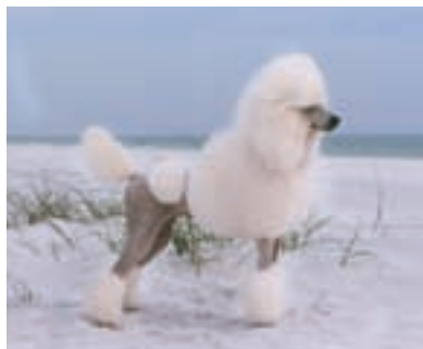
Bílý velký pudl ve výstavním stříhu.

Na pudlovi nás na první pohled zaujme jeho jemná, kadeřavá srst. Neexistuje žádné jiné psí plemeno, které by bylo možné stříhat na tolik různých způsobů, jako je tomu u pudla. Jak má stříh vypadat, se však předepisuje pouze pro psí výstavy 2 . Majitelé aktivně sportujících pudlů volí nejčastěji krátký stříh, který se dá udržovat daleko snadněji. Pochopitelně, že úpravou srsti změníme pouze vzhled pudla, jeho povaha zůstane nedotčená. I za extravagantním stříhem se skrývá pravý pes, který rád skáče, běhá a plave. Stříhání je potřeba k tomu, aby