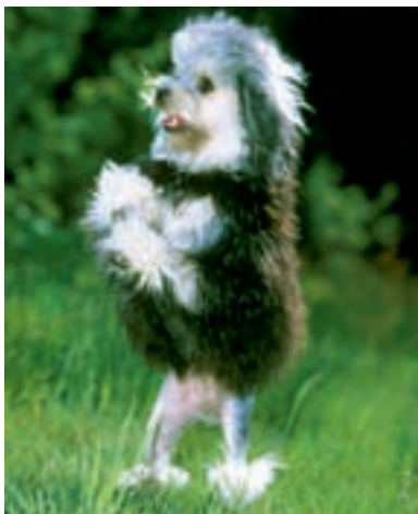
Rovněž lvíček nosí typický „pudlí účes“.

se pudlíci cítili dobře. Jejich objemná srst roste i v obličejové části, kde by nezkracovaná mohla jednoho dne začít omezovat výhled našeho čtyřnohého přítele. Pudl líná v průběhu celého roku, na rozdíl od ostatních psů línajících většinou na jaře a na podzim. Příjemné je, že uvolněné pudlí chlupy neulpívají na oblečení nebo v koberci, ale zůstávají v srsti, proto se musí pravidelně vyčesávat, aby srst nezaplnatěla.