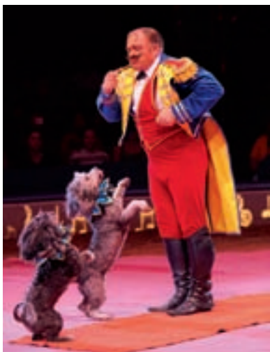
Díky své inteligenci je pudl již odedávna ceněn v cirkuse.

Nápadný je ladný způsob chůze pudla. Elegantní, úžasně pružné pohyby nám připomínají tanečnicka. V klusu vypadá, jako by se sotva dotýkal země. Hrdé držení hlavy a ocasu vyvolává velmi sebevědomý a ušlechtilý dojem, není proto divu, že pudl byl tak oblíben na královských dvorech.