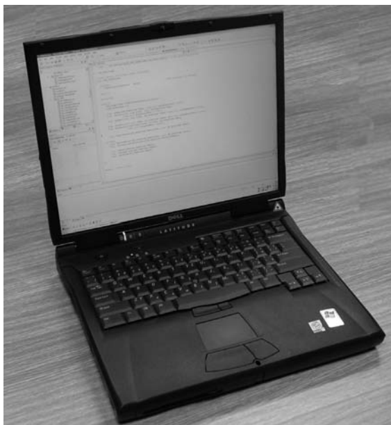
Obrázek 1.1: Notebook

Velkou část jejího prostoru zaujímá zdroj napájení. Je chlazen ventilátorem, což někdy způsobuje nepříjemný hluk. Ve zbývajících částech je uložena především základní deska ( motherboard ), na níž je všechno, co dělá počítač počítačem.