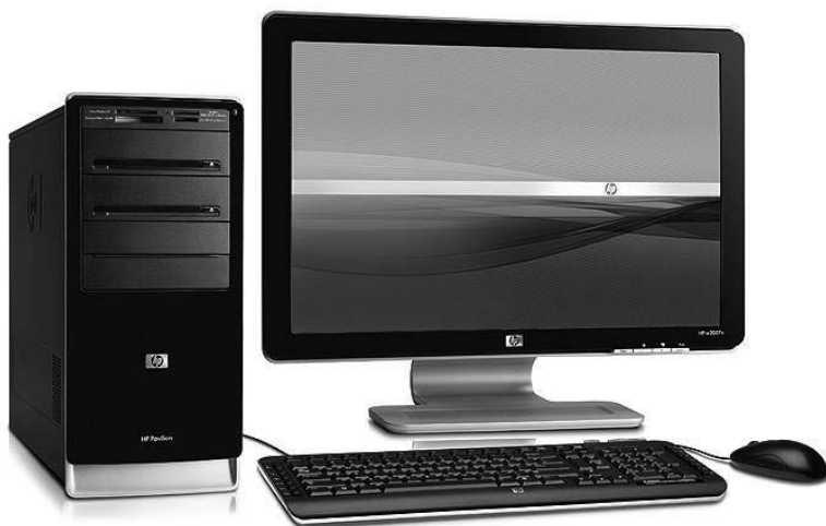
Obrázek 1.1: Hardware je to, na co si můžete na pracovním stole sáhnout – tedy technika

Software pak označuje to nehmotné. Jsou to především programy, které v počítači běží a jejichž okna a ovládací prvky vidí-