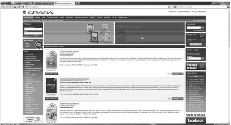
Obrázek 1.9: Internetový prohlížeč slouží k procházení internetu

Internet slouží k přenášení informací a poskytování mnoha služeb, jako jsou kupříkladu elektronická pošta, chat, webové stránky, sdílení souborů, on-line hraní her, vyhledávání, katalogizace atd. Otázkou zůstává, co to vlastně je internet fyzicky? Mohli bychom využít přirovnání k železničním tratím. Na počátku železniční dopravy, ještě v 19. století, vznikla tu a tam nějaká ta osamocená lokální trať. Později se koleje těchto tratí začaly propojovat, překročily hranice krajů a posléze i hranice států. Nakonec jsme dospěli k dnešnímu stavu, kdy koleje oplétají celý