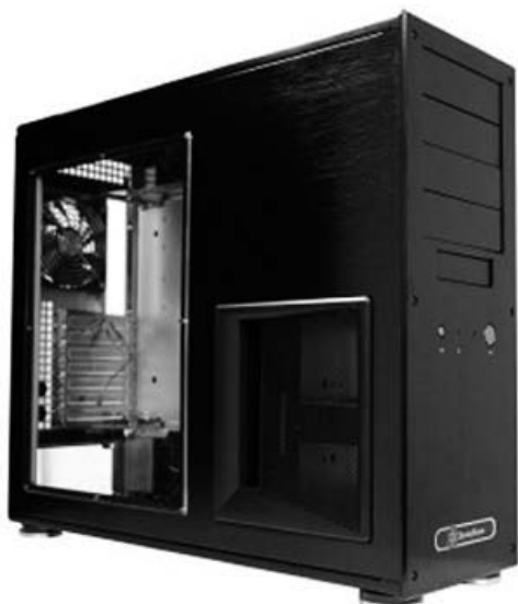
Obrázek 1.3: Počítačová skříň bez komponent

ry pro připojení myši, klávesnice, tiskárny a jiných zařízení. V současnosti se na základní desku často integruje i grafická karta, zvuková karta a síťová karta.