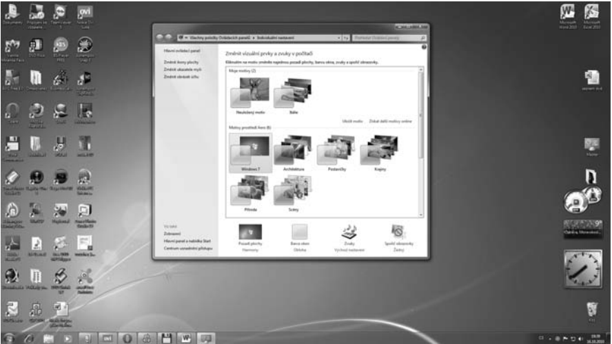
Obrázek 1.2: Software jsou počítačové programy

te na obrazovce. Software lze rozdělit na systémový software, jenž zajišťuje chod samotného počítače a jeho styk s okolím, a na aplikační software, se nímž pracuje uživatel počítače.