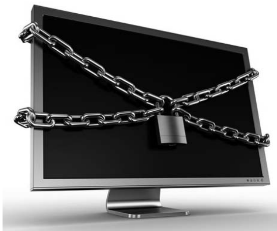
Obrázek 1.10: Zabezpečení počítače nelze podcenit

va, která uživatele varuje před nějakým virem, prosí o pomoc, informuje o nebezpečí, snaží se ho pobavit apod. Hoax většinou obsahuje i výzvu požadující další rozeslání zprávy přátelům, případně na co největší množství dalších adres – proto se někdy označuje také jako řetězový e-mail. Běžní uživatelé hoaxům často věří a (v dobré víře) jednají podle nich, tedy je rozesílají dále ve snaze pomoci i ostatním, nebo je považují za pouhý neškodný vtíp. Odborníci a správci sítí často hoaxy chápou jako nebezpečný jev, kterému je třeba se bránit.