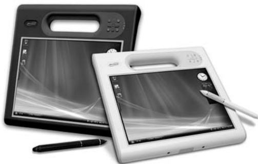
Obrázek 1.5: Tablet je extrémně přenosný minipočítač

Notebooky s displejem větším než 17 palců označujeme jako deskbook. Do této kategorie patří velké notebooky, které jsou určené jen pro práci v kanceláři. K pravidelnému přenášení nejsou vhodné. Díky kvalitnímu hardwaru a velkému displeji je využívají hlavně grafici a architekti na prezentaci výrobků a služeb.