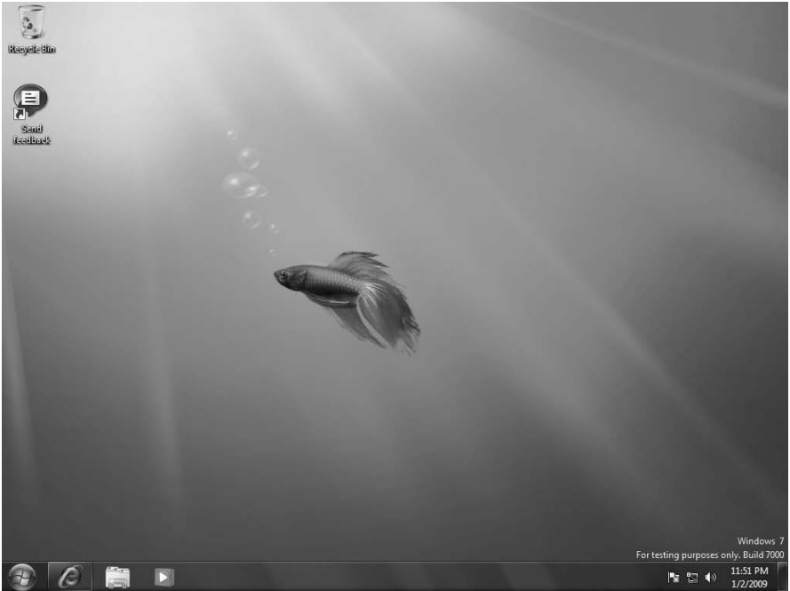
Obrázek 1.7: Pracovní plocha operačního systému Windows 7