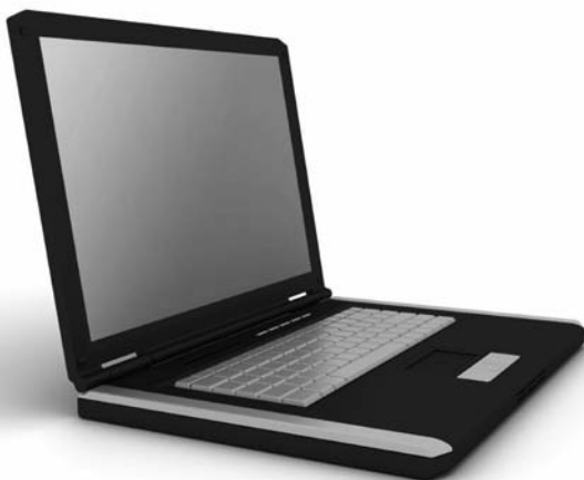
Obrázek 1.4: Notebook, aneb přenosný počítač

Klasický notebook má displej o úhlopříčce 13–17 palců (1 palec je 2,54 cm), váží okolo 2,5 kg a má zabudovaný zdroj energie – akumulátor. Notebook se 17palcovým displejem je označován jako velký