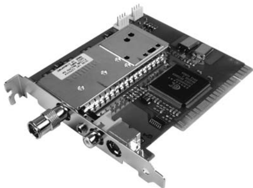
Obrázek 1.6: Karta pro příjem televizního vysílání v počítači

tifunkční zařízení, kombinující tiskárnu a skener.