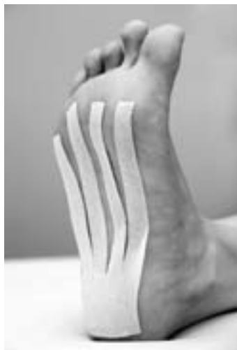
„Fork“ tape, tvar vidličky