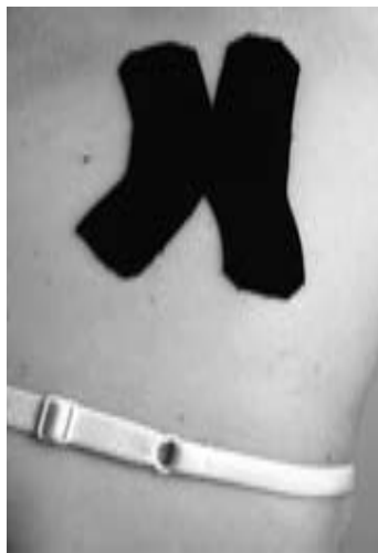
X tvar tapu