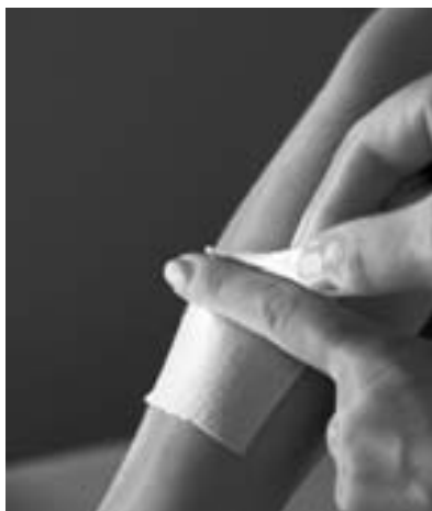
Odlepování s přiloženým prstem

Zejména na neoholených částech těla může být snímání pásky nepříjemné. Rychlé strhnutí pásky nedoporučujeme, neboť tím zvyšujeme podráždění kůže, které by později mohlo zbytečně zabránit v dalším léčebném lepení. Při snímání pásky z těla přiložíme prst těsně před část tapu, kterou chceme odlepit, a přitlačíme. Tím odlehčíme kůži a odlepování je snesitelnější.