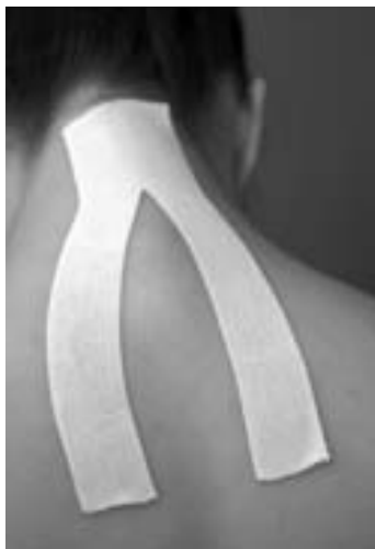
Y tvar tapu

Dvoucentimetrové pásky jsou určeny pro jemnější taping, např. u prstů na ruce. Pěticentimetrové pásky často stříháme ostrými nůžkami do tzv. Y, X tvarů nebo volíme „Fork“ tape ve tvaru vidličky, a to podle velikosti plochy tapované oblasti (sval, nerv).