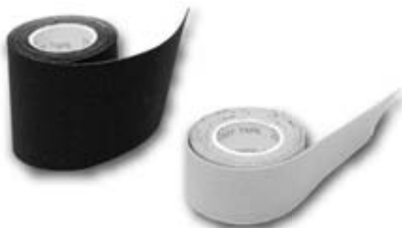
Dostupná šířka pásek na českém trhu

K-tape se přikládá na kůži a nechává se působit i několik dní. Dokud se sportovci (pacientovi) K-tape neodlepí – což závisí na druhu a intenzitě zatížení vlastní pásky –, nechává se na těle. Rozdíl oproti normálnímu tapu spočívá v tom, že K-tape neodlepujeme okamžitě po tréninku či ukončení zátěžové činnosti, ale můžeme jej ponechat na místě. Na českém trhu jsou v tuto chvíli k dostání pásky různých barev o šířce dvou a pěti centimetrů.