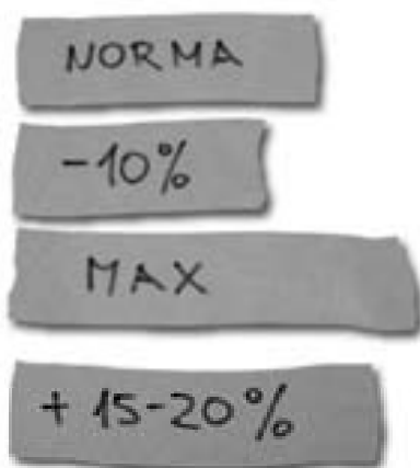
Názorná ukázka možností natažení pásky

Velikost natažení pásky ukazuje obrázek.