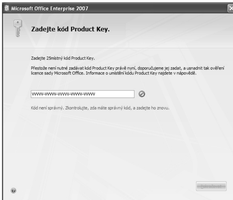
Obr. 1.1: Vložení kódu

Instalátor vás ihned požádá o vložení instalačního kódu; pokud jej zadáte chybně, bude reakce podobná jako na obrázku 1.1. Pokud se vše podařilo, k další části instalace postoupíte stiskem tlačítka Pokračovat .