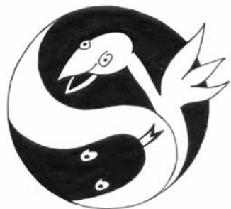
Obr. 2 Had a jeřáb

Snad žádné jiné bojové umění není opředeno tolika fascinujícími legendami a příběhy. Jedna ze známých zkazek připisuje vznik Tai chi taoistickému filozofovi Zhang San-fengovi ze 13. století, který k shaolinským bojovým myšlenkám dodal myšlenky taoismu. Traduje se, že Zhang San-feng spatřil boj hada a bílého jeřába, inspiroval se jejich kruhovými pohyby a objevil tak Princip Tai chi, který si později podrobně vysvětlíme. Legendy označují tohoto filozofa za nesmrtelného a na důkaz jeho nesmrtelnosti zasazují jeho život hned do několika staletí.