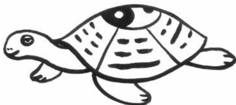
Obr. 1 Želva

Vývoj čínských bojových umění překlenuje dobu tří tisíciletí. Prvopočátky boje a rozvoj bojových technik lze vysledovat již v dobách před naším letopočtem z vyobrazení rituálních bojových tanců na kostech a želvích krunyřích.