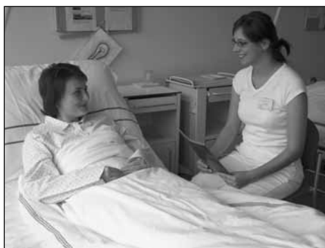
Obr. 1 Vhodná pozice pro vedení edukace

Pohledy – pohledy z očí do očí patří mezi nejčastější druhy nonverbální komunikace. Při vedení rozhovoru by měly být oči zdravotníků a klientů přibližně ve stejné výšce (obr. 1). Zdravotníci by měli sedět vůči klientům vždy do pravého úhlu. Toto uspořádání napomáhá u klienta vyvolat pocit přátelské atmosféry a umožňuje klientovi, kdykoliv bude chtít, navázat zrakový kontakt.