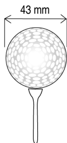
míček s kolíčkem

sklon hlavy (47 až 64 stupňů). Pro úder v jamkovišti, při dopravě míčku do jamky, se uplatňují hole s přímou rovnou hlavou (sklon 3 až 4 stupně), tzv. putter .