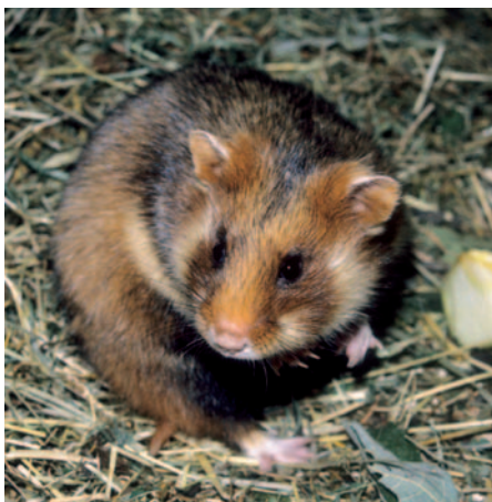
Křeček polní je typickým zástupcem eurasijských křečků

Ne všichni však vypadají tak, jak si větší na lidí křečka představuje – tedy jako středně