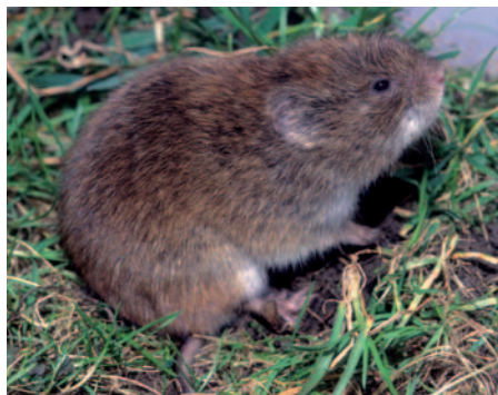
Hraboš východní ( Microtus fortis ) připomíná svou postavou některé americké křečky, ale v současné době stojí již v systému na jiném místě

Podobně jako ostatní příslušníci řádu hlodavců ( Rodentia ), mají i všechny podčeledi křečků silně redukovaný chrup, který je u nich složený z 16 zubů (1003/1003), což znamená, že mají v každé polovině čelisti po jednom řezáku, odděleném od tří, obvykle hrbolkatých stoliček, širokou mezerou, která se nazývá diastema.