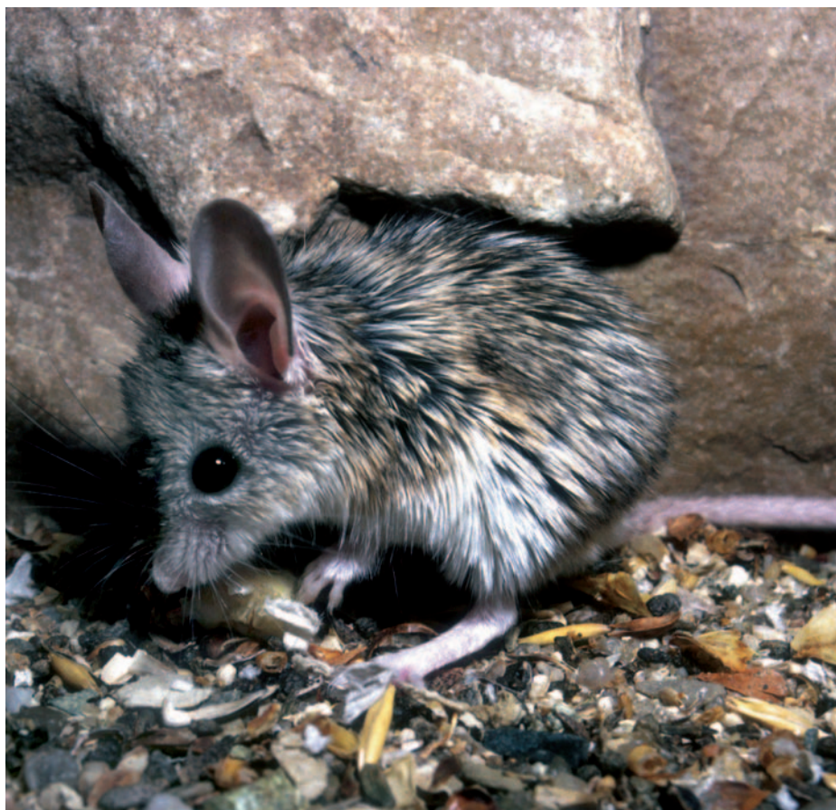
I drobný křečík myší se může při dobré péči dožít věku 9 let

neme. Každé zvíře, které se rozhodneme chovat, se zcela nutně stává naším partnerem, a proto způsobí v našem životě určité změny a kromě nových zážitků a obohacení života nám přinese i určitá omezení. Není tedy od věci položit si ještě před jeho pořízením několik otázek a poctivě si na ně odpovědět. V případech křečků bychom si měli rozmyslet především následující otázky: