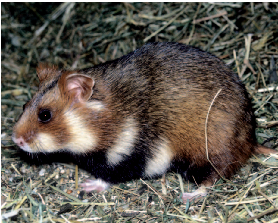
Ještě na přelomu 19. a 20. století se v Evropě ročně ulovilo statisíce křečků polních – v současnosti patří ve většině států mezi vzácnosti

ještě o něco předčí křeček velký ( Hypogeomys antimena ), který má délku těla až 350 mm a ocasu až 240 mm. Navíc může dosáhnout hmotnosti až 1500 g, což je mezi křečky opravdový rekord.