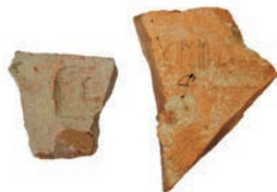
Rímske kolkované tehly nájdene v centre Bratislavy

Stopy po Keltoch a Rimanoch sa útržkovito našli v areáloch viacerých objektov. Pamiatky pravekej a starovekej Bratislavy predstavujú aj početné exponáty v múzeách, najmä v zbierkach Archeologického múzea SNM (s. 110). V Pálffyho paláci zriadili expozíciu Keltská mincovňa (s. 80). Pozoruhodné nálezy – antickej kamenné stavby z čias Keltovej, odkryli v areáli Bratislavského hradu (s. 94 – 103). Najkrajšou rímskou pamiatkou je vojenský tábor Gerulata (s. 196 – 197) v mestskej časti Rusovce. Pri rímskych vykopávkach vzniklo múzeum dokumentujúce život Rimanov v Bratislave. Murované stavby zanechali Rimania aj v areáli hradu Devín (s. 182 – 185). Pozoruhodným objektom z čias Rímskej ríše je Villa rustica v mestskej časti Dúbravka (s. 186).