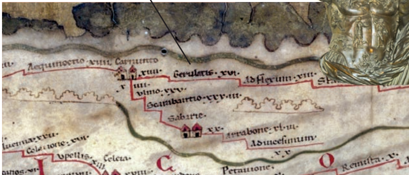
Tabula Peutingeriana, stredoveký prepis mapy z čias Rímskej ríše, ktorá zachytáva aj oblasť stredného Dunaja

Tábor Gerulata v mestskej časti Rusovce je na mape vyznačený vo vzdialenosti 14 rímskych míľ od Carnunta