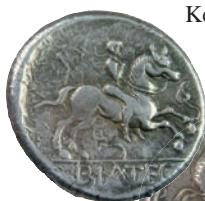
Bratislavské keltské mince

Kelti sú prvým etnikom na území Bratislavy, ktoré vieme pomenovať. Do Bratislavy prišiel keltský kmeň Bójov. Na základe početných archeologických nálezov je známe, že Kelti na území mesta založili veľké centrum (tzv. oppidum), ktoré v tom čase patrilo k najväčším v strednej Európe. Vzniklo na dnešnom hradnom vrchu a na východ od neho. Rozkladalo sa na území medzi Palisádami, Svradovou ulicou, Hurbanovým námestím, Námestím SNP, Panskou a Laurinskou ulicou po južné svahy Hradu. Pece určené na výrobu keramiky sa našli v priestore Námestia slobody. Keltské oppidum dosahovalo väčšiu rozlohu ako neskoršie stredoveké mesto. Význam oppida násobí nález keltskej mincovne