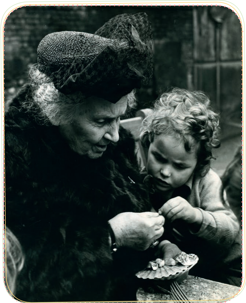
Fotografia MM s dieťaťom